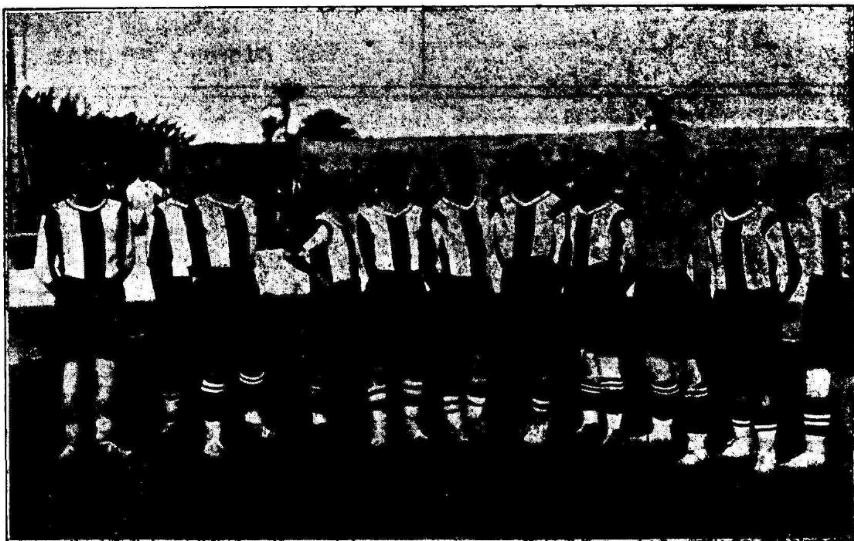
Equipo del Club Deportivo Murciano