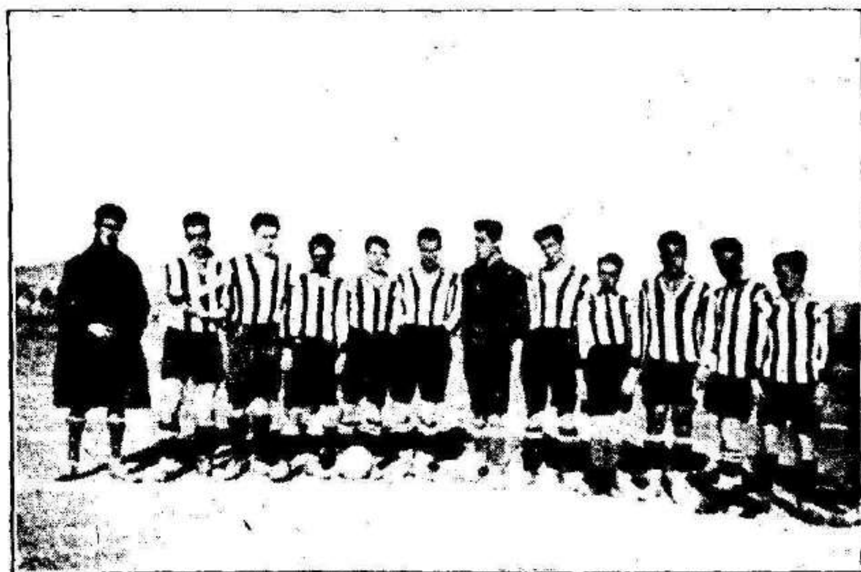
El notable equipo de Socuéllamos, campeón de Ciudad Real.

aquí de merecidas simpatías y de gran admiración y por lo que respecta a los nuestros, la Junta Directiva ha tomado el acuerdo de que en los encuentros que juegue el Deportivo se alinen sólo en sus filas jugadores de esta Sociedad; nada de refuerzos con personal extraño que sólo tiene por objeto ganar a toda costa, cubrir defectos de los propios y nosotros queremos ganar naturalmente, pero más que ganar lo que deseamos es cultivar el sport, despertar la afición.