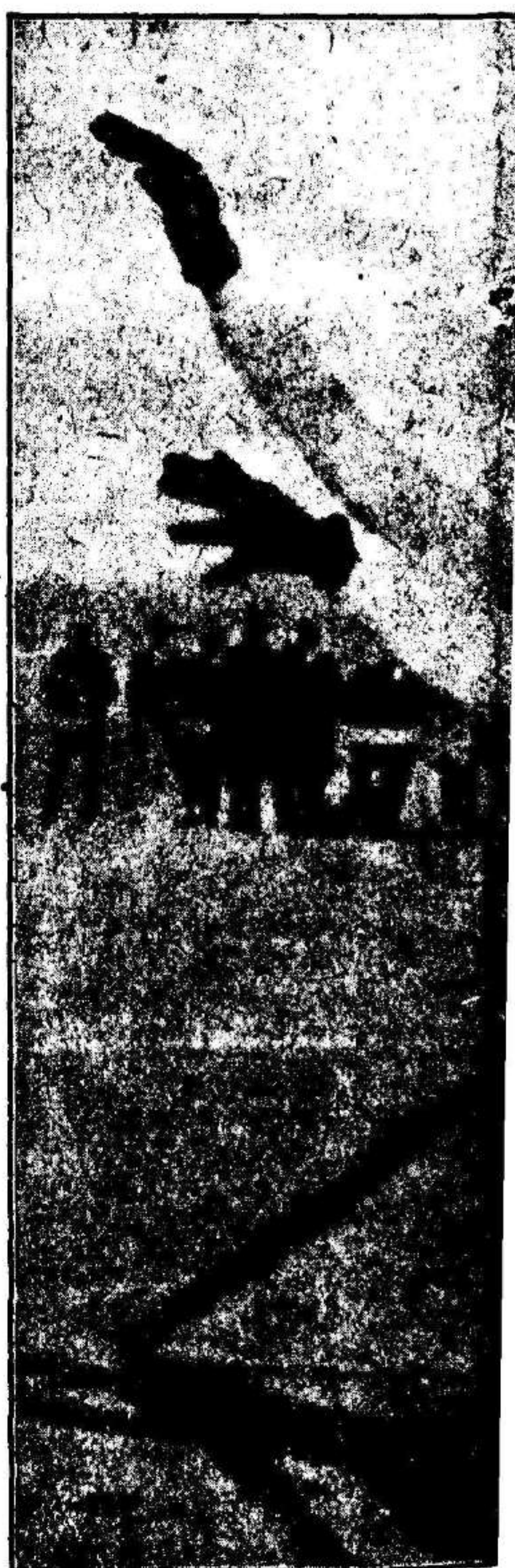
El gran portero Zamora qu del Español