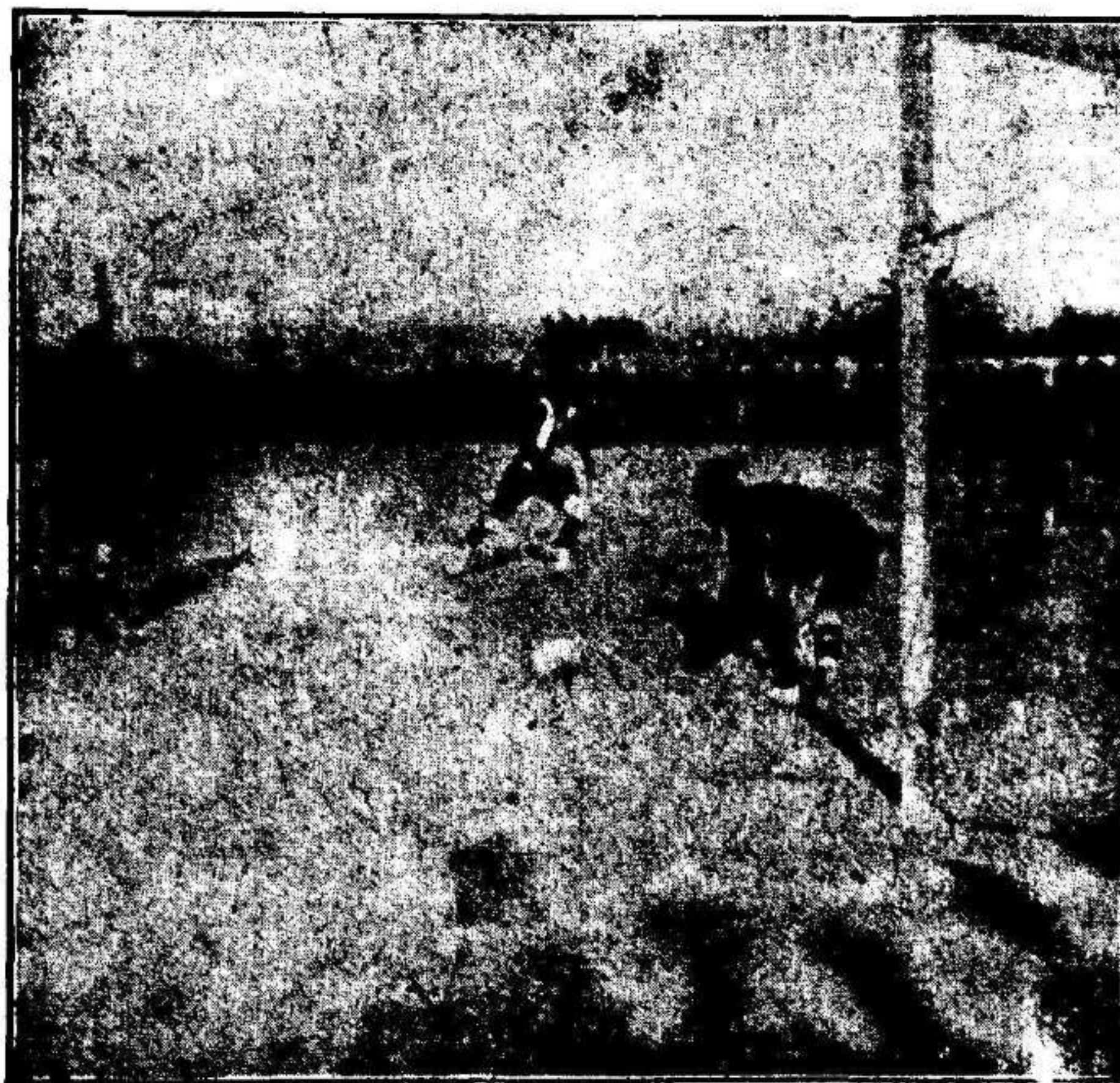
Jusep en una de sus notables paradas