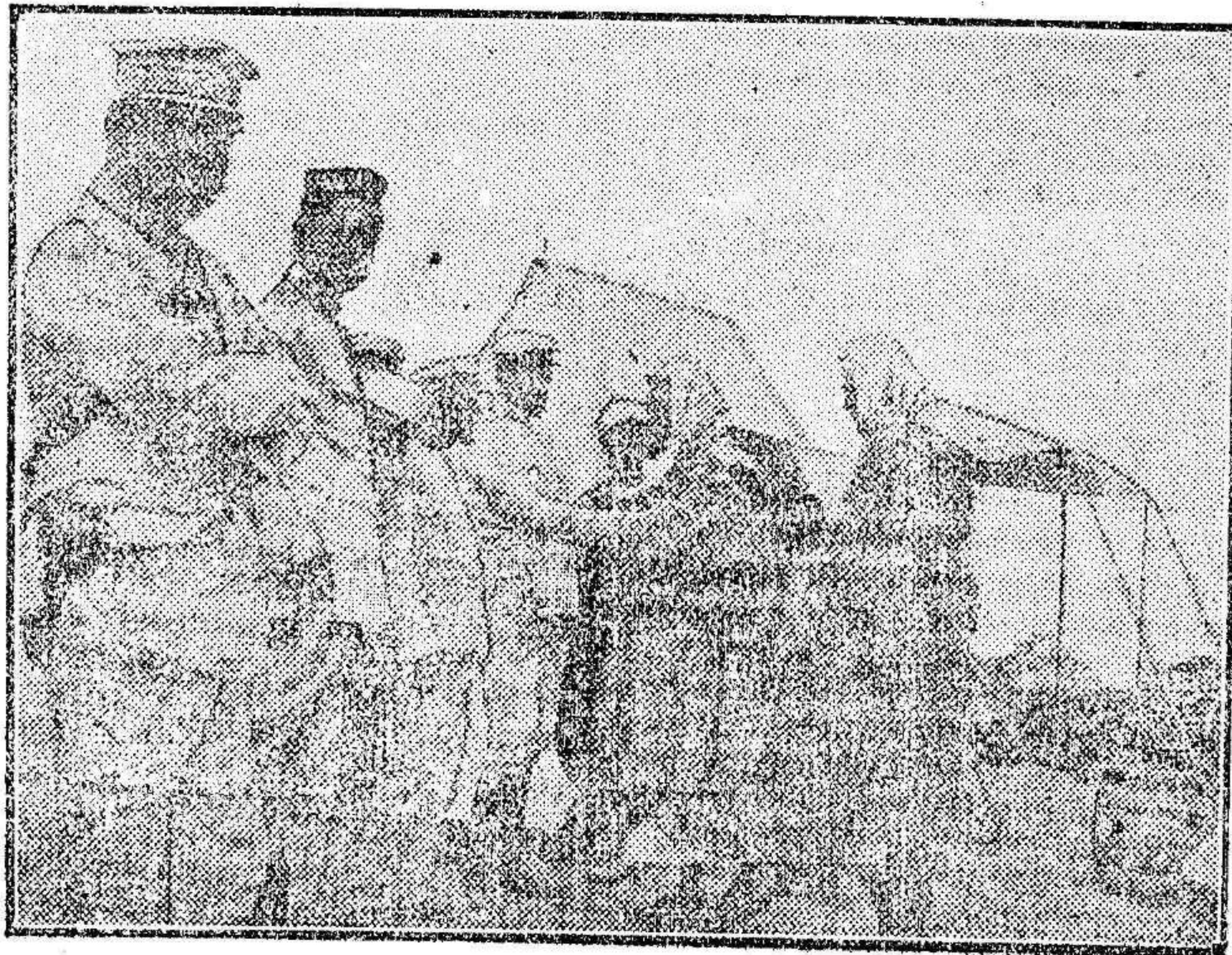
Oficiales españoles interrogando á dos moros detenidos en las cercanías del campamento del Hipódromo en Melilla.

á los correspondientes para que las telegrafen. Con esto cesará la intranquilidad de millones de familias.