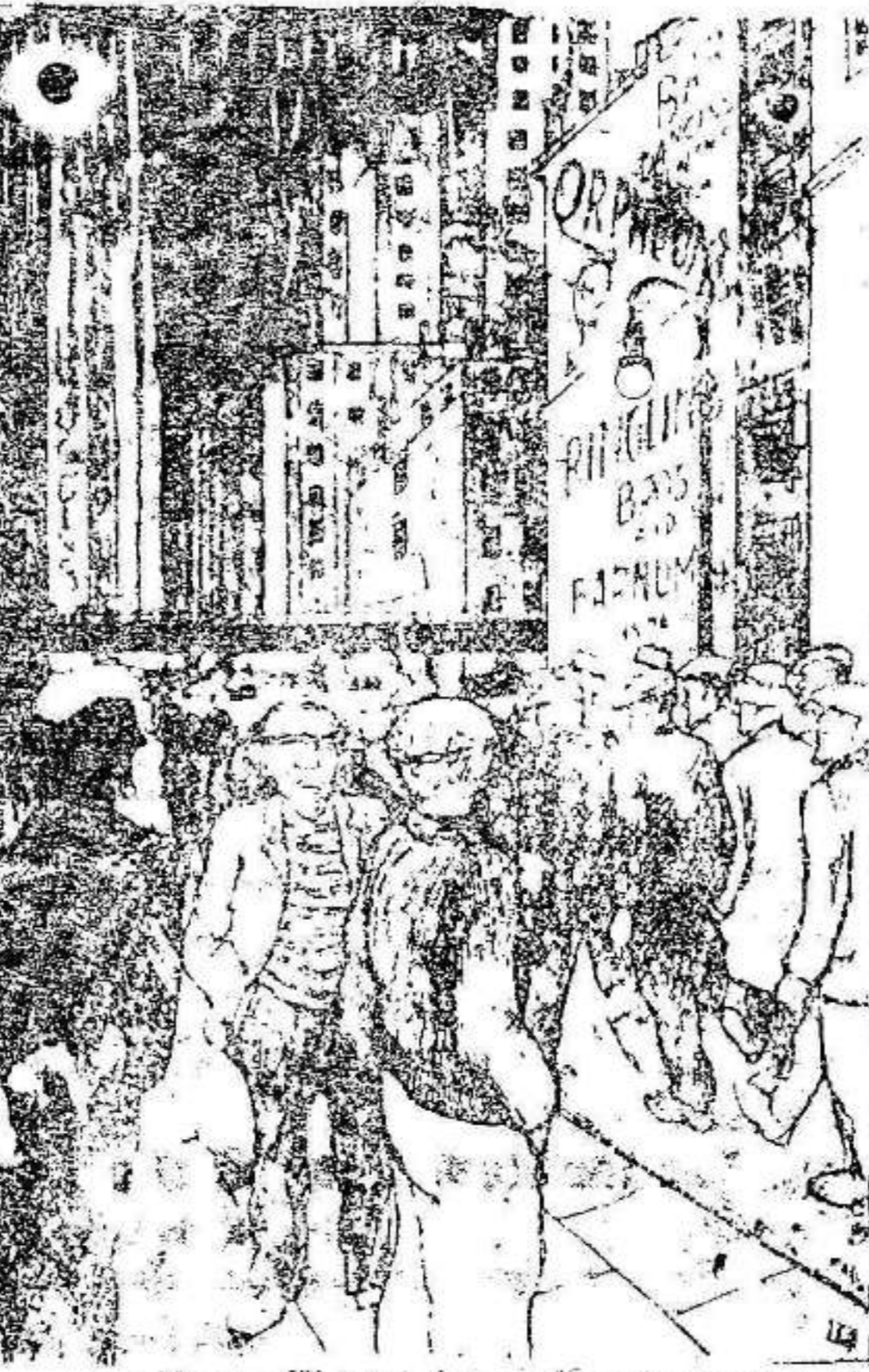
LA PATRIA Y SUS HEROES

Frutas y hortalizas. Precios por kilos. Ciruelas. 6 ptas. 10 cts. Peras 40. Nísperos 93. Melones 30. Limones 40. Guisantes 0. Calabaza trera 0'25. Idem tiernas 0'25. Lechugas 0'90. Pepinos 0'60. Pimientos 6 ptas. kilo; pescadilla, 4'00. Empeño 3'00. Atun, 5'00; paja, 4'00. Salzón, 2'50; calamars, 6'00; jibia, 3'00; majo, 2'50; bacalao, 1'00; merlu, 0'25; dorada, 4'00; pulpos, 2'00; jurel 0'80; besugo, 3'00; bonito, 3'00; alacha 0'60; boga 0'80; sardina, 0'80; salmo, 1'00; chireste, 1'20; langostinos 5'00; gambas, 5; almeja, 1, 20.