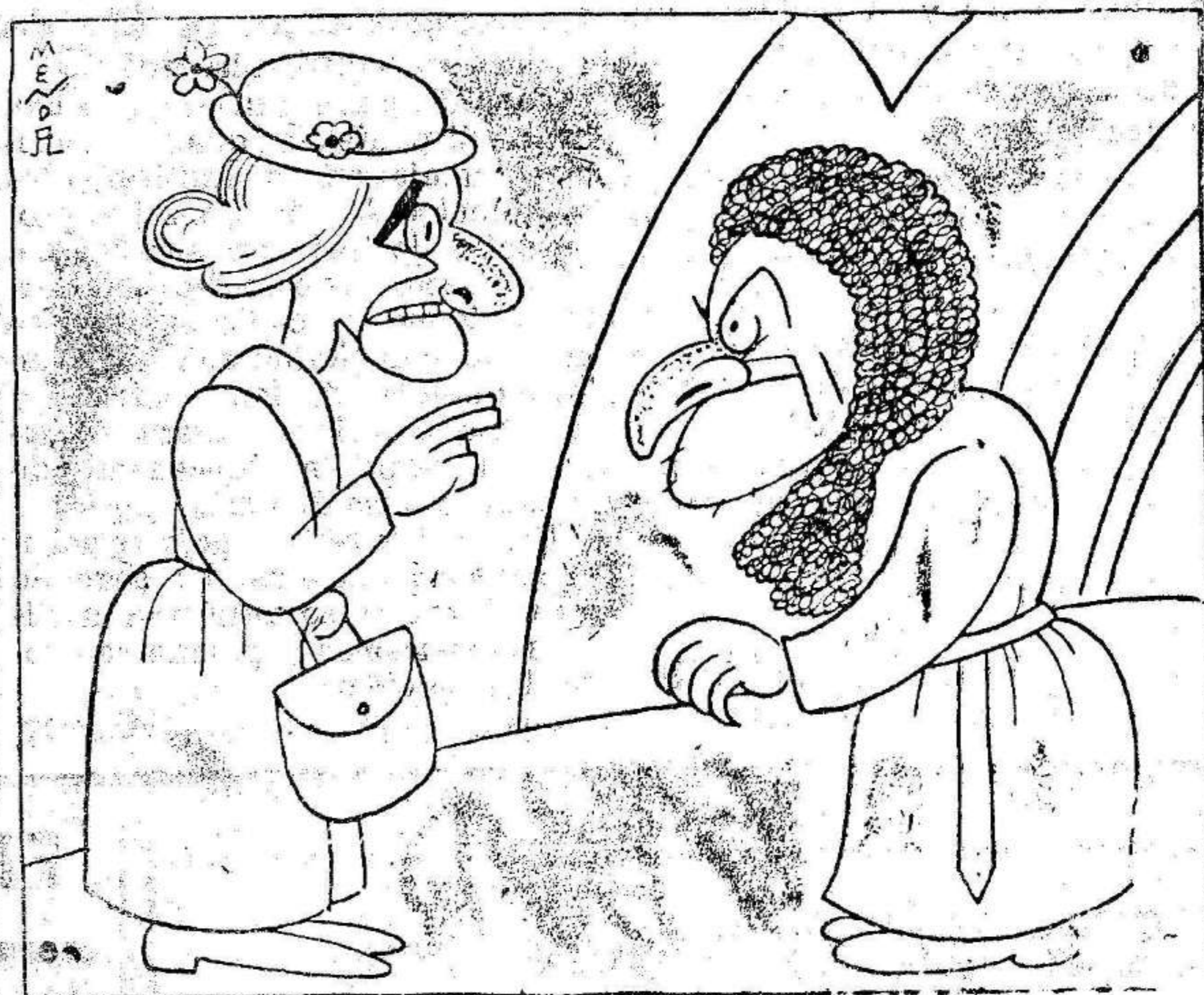
—Ya ve usted; los santos preladados querían convertir los bienes de la Iglesia en moneda extranjera