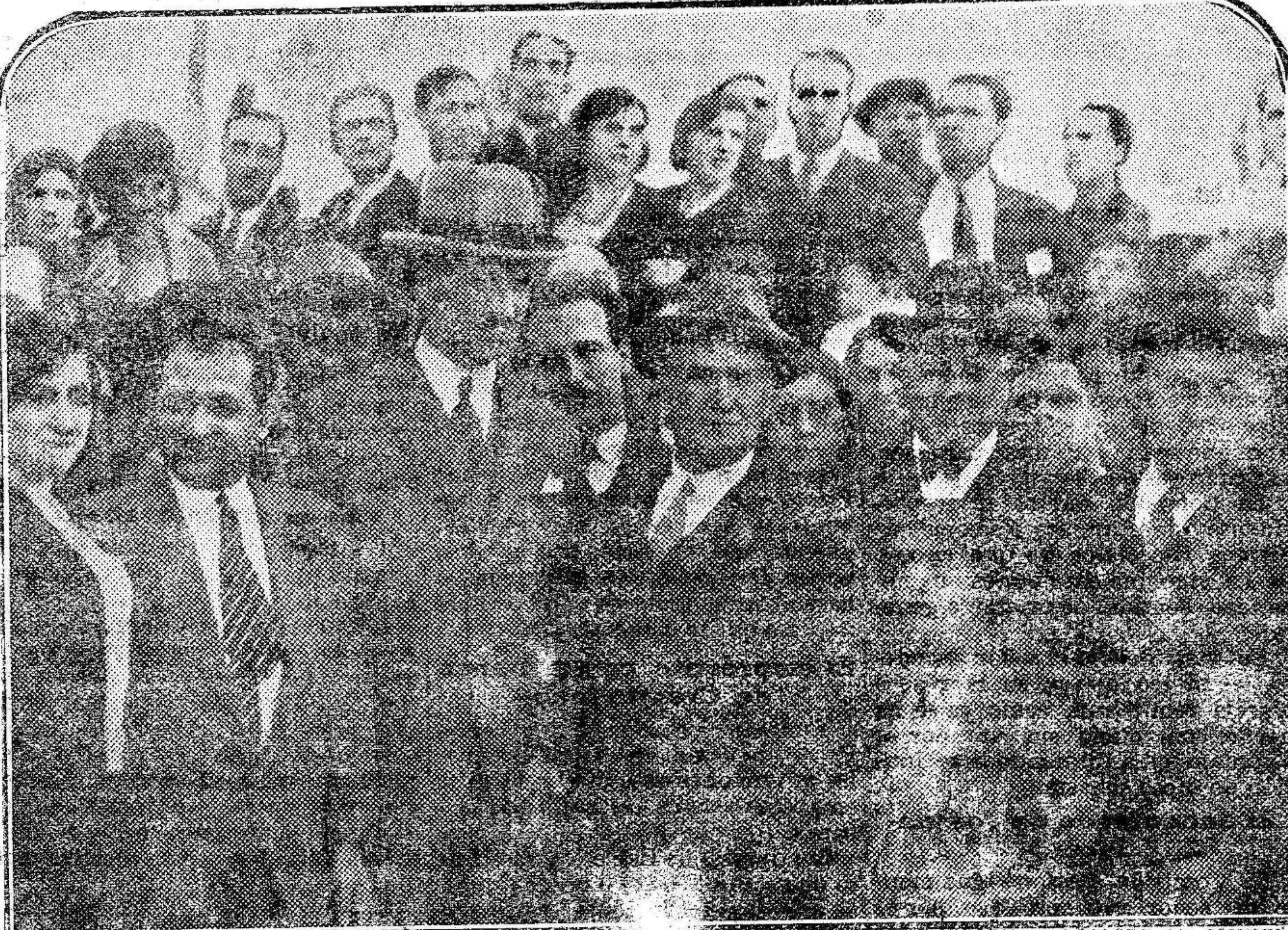
Los presos y emigrados políticos que hoy rigen los destinos de España

una información de su redactor señor Gutiérrez de Miguel, sobre una conversación con el general Bргуete, último presidente del Consejo Supremo de Guerra y Marina.