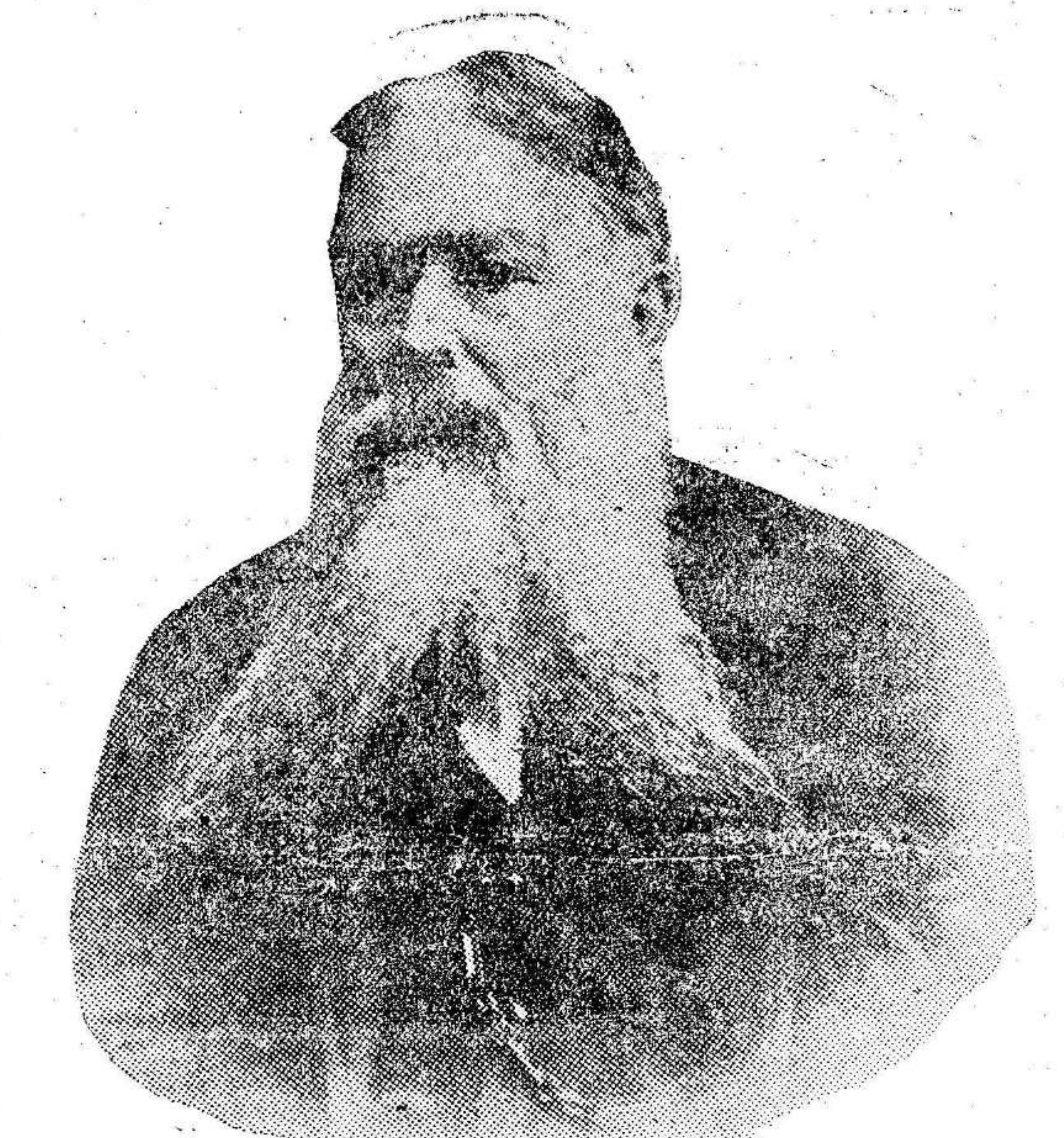
Antonete Galvez, glorioso caudillo del Cantón murciano. Los pueblos de Torreagüera, Beniaján, Los Garres, Algezares y la Alberca, enclavados en la falda de las montañas que presenciaron la gesta romántica del insigne republicano, lucharon en la jornada del domingo con el mismo amor a la Libertad que llevó a Antonete Galvez a defender sus ideales con las armas en la mano.

El resultado en la capital Como verán nuestros lectores por la información detallada que les ofrecemos a continuación, en la capital ha triunfado la candidatura de izquierdas.