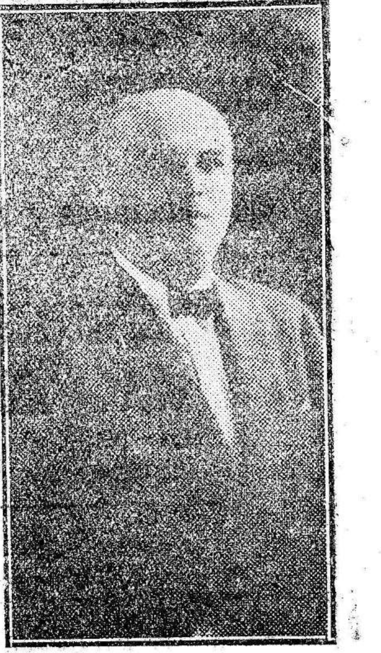
D. Mariano Ruiz-funes, del grupo Acción Republicana dentro de la Alianza.