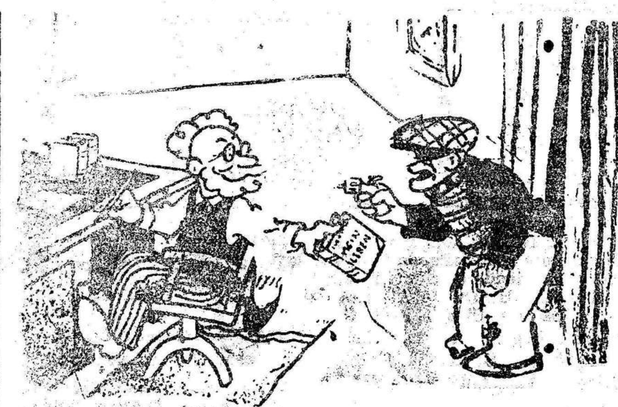
EL LADRON.—Su bolsa o su vida. EL AUTOR.—¿Abi tiene usted mi «Vida», escrita por mí mismo. Encuadrada y todo, cuatro pesetas.

podrían protestar dice: «¿erto también, pero es lógico pensar que ellos no se han de manifestar y que aún haciéndolo perderían por razón numérica en votación.»