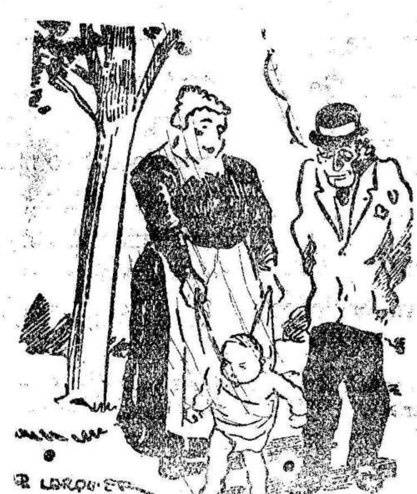
—¿Hace tiempo que anda este niño? —Unos ocho meses. —¡Caray! Debe estar muy cansado...