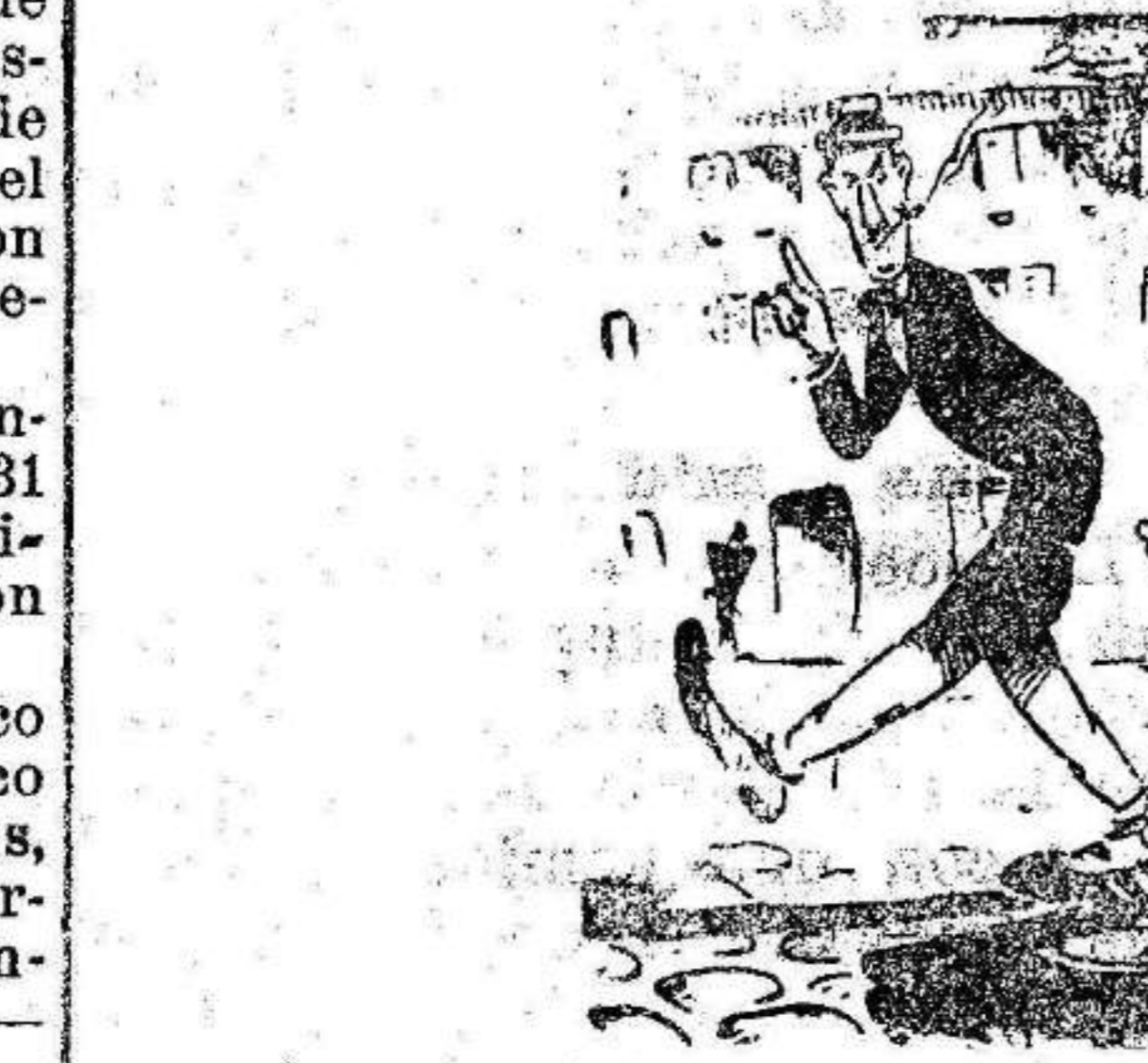
—...Y aquí es donde el problema comienza a complicarse... ¿Me sigue usted? —¡Con mucho trabajo, porque dá usted unas zancadas tan largas!