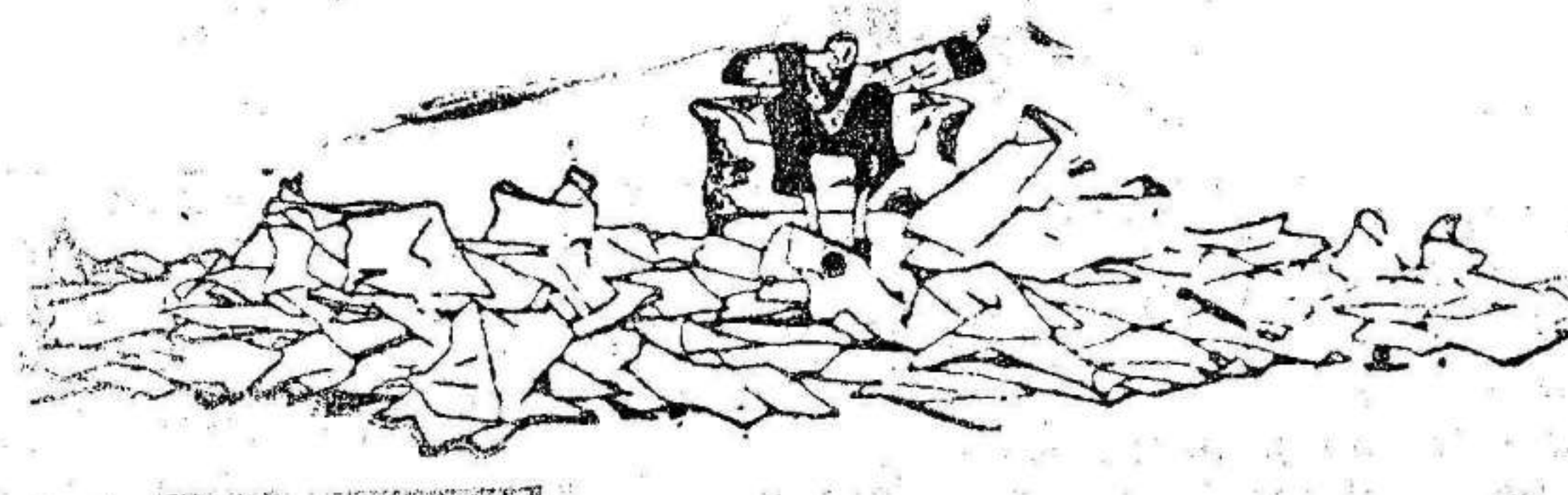
—¡Oh! ¡Qué fastidio! El periódico de hoy no trae nada!