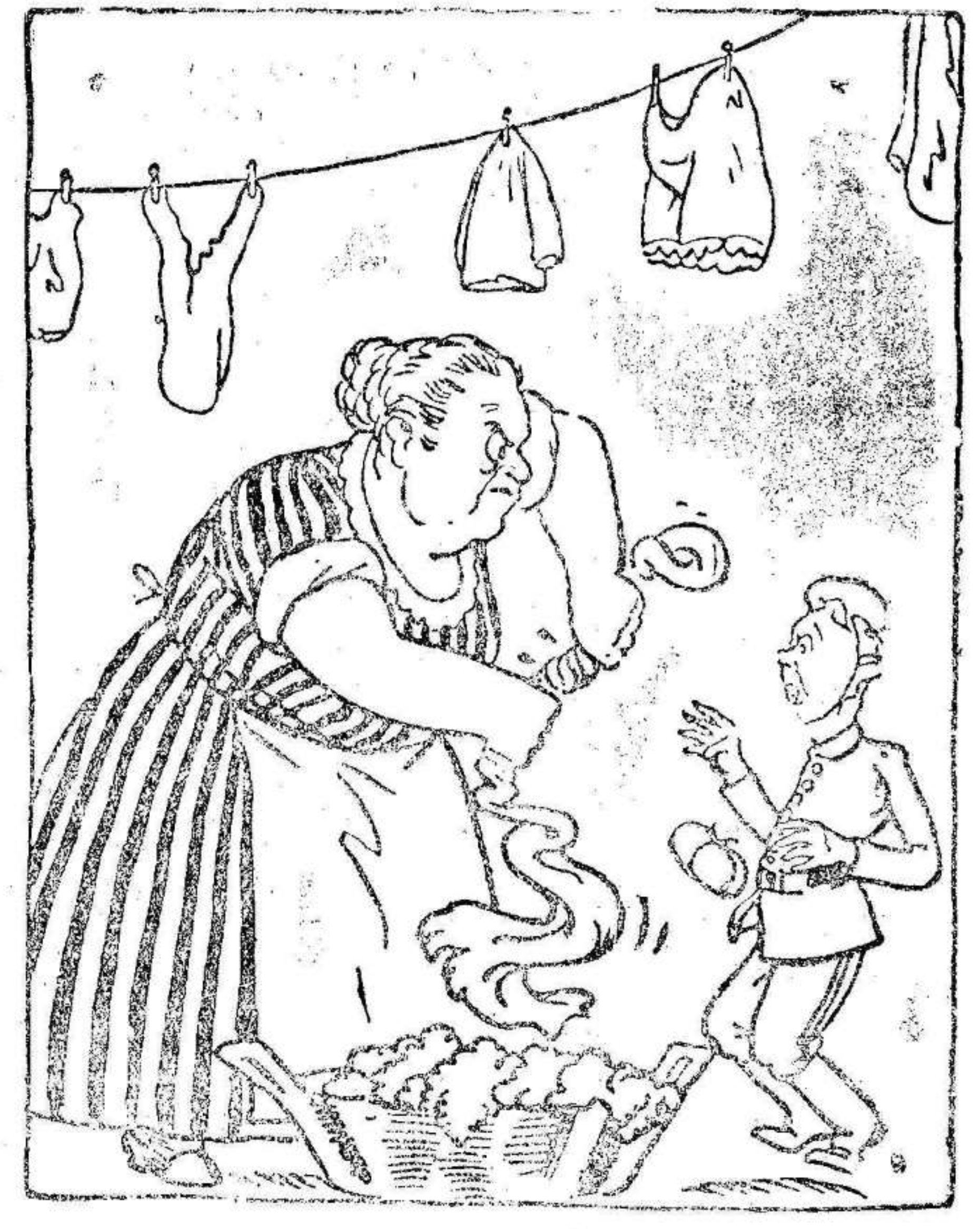
—Una palabra más, mequetrefe, y te refuerzo el pescuezo.

El precio del grano también ha subido, pues pasado el pánico de los primeros días en que se pagaron los cien kilos a 32 pesetas, se vienen pagando entre las 33 y 35 pesetas, realizándose abundantes operaciones, por lo que el precio es firme con tendencia al alza.