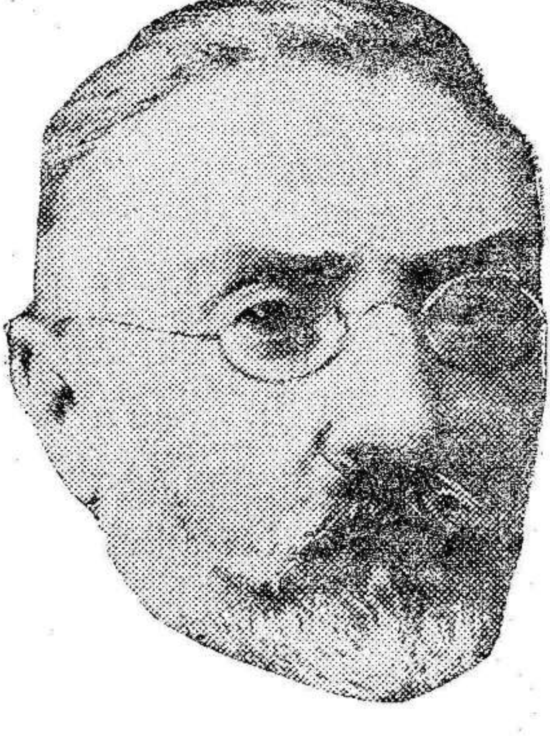
D. Miguel de Unamuno

Las sociedades obreras afectas a la Unión General de Trabajadores, invita a sus afiliados para que acudan a este importante acto.