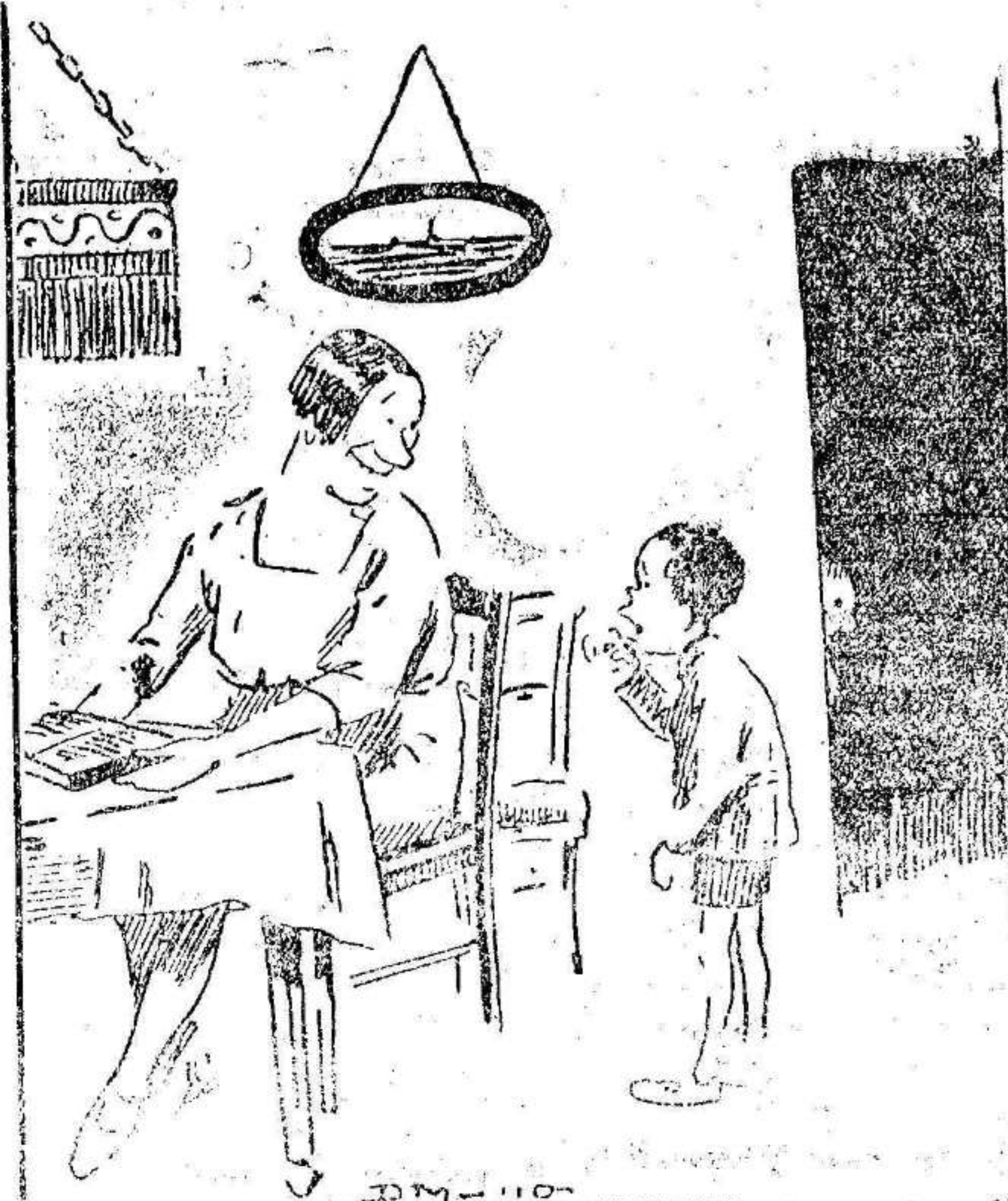
—Los niños de arriba «man» «pegao» —No se dice «man». Se dice «me han». —Buano, pues dame un «meñateco». («Unión Mercantil».)

La niña desapareció del sitio en la que la dejara su madre y después de buscarla fué hallada en el interior de un armario, dando señales de asfixia.