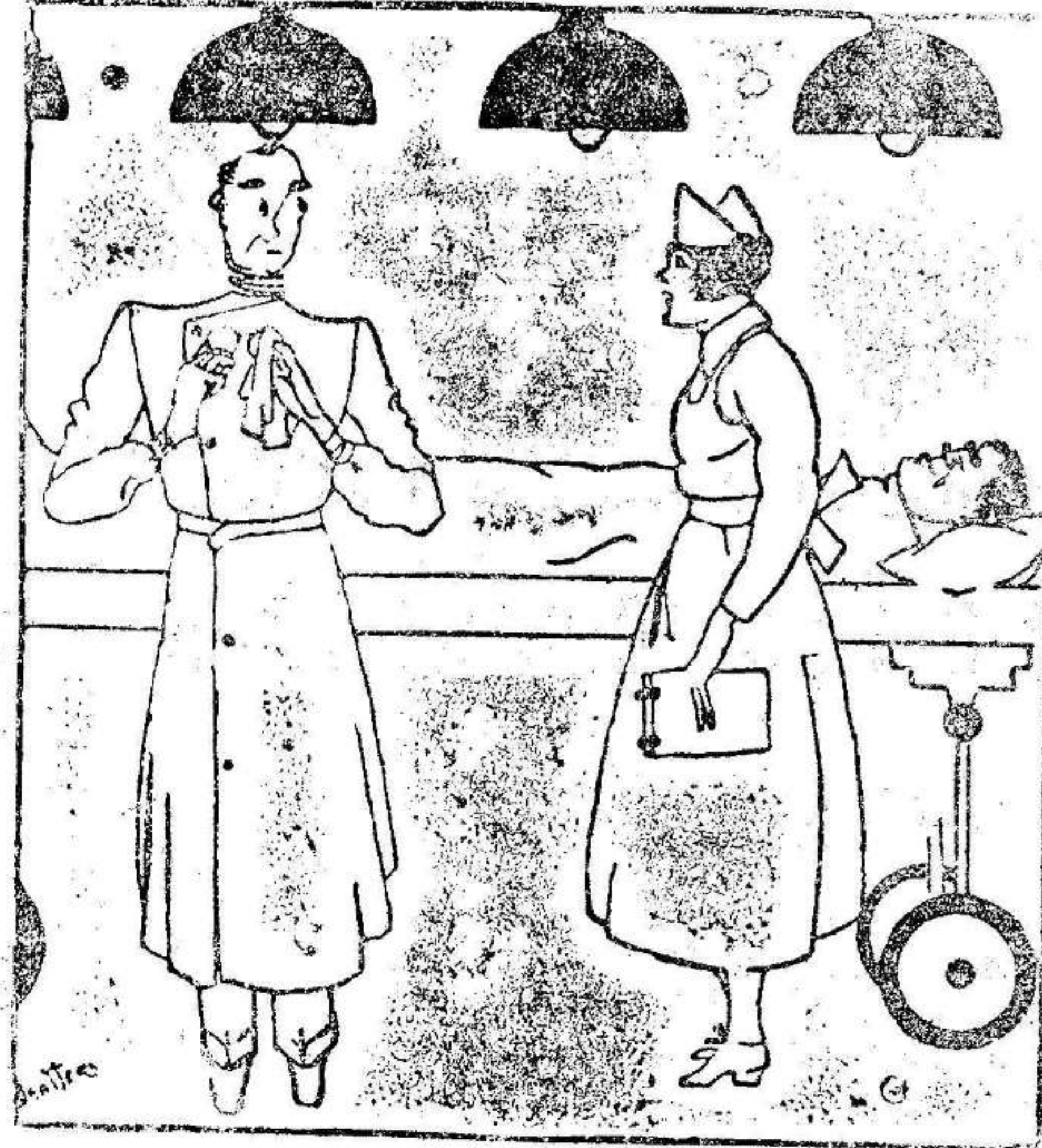
LA ENFERMERA.—¿Le inscribo como caso de apendicitis, doctor? EL CIRUJANO.—No; ponga usted, sencillamente: «Abierto por equivocación».