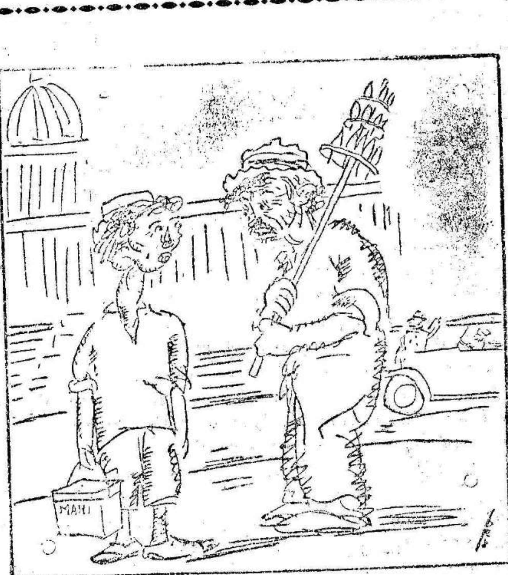
EL VIEJO PIRULERO.—Hijo mío, abre mucho los ojos con los billetes falsos de a cien pesos. («Diario de la Marina», de la Habana.)

Con esta se consigue que la peseta continúe estacionada y su cambio no suba.