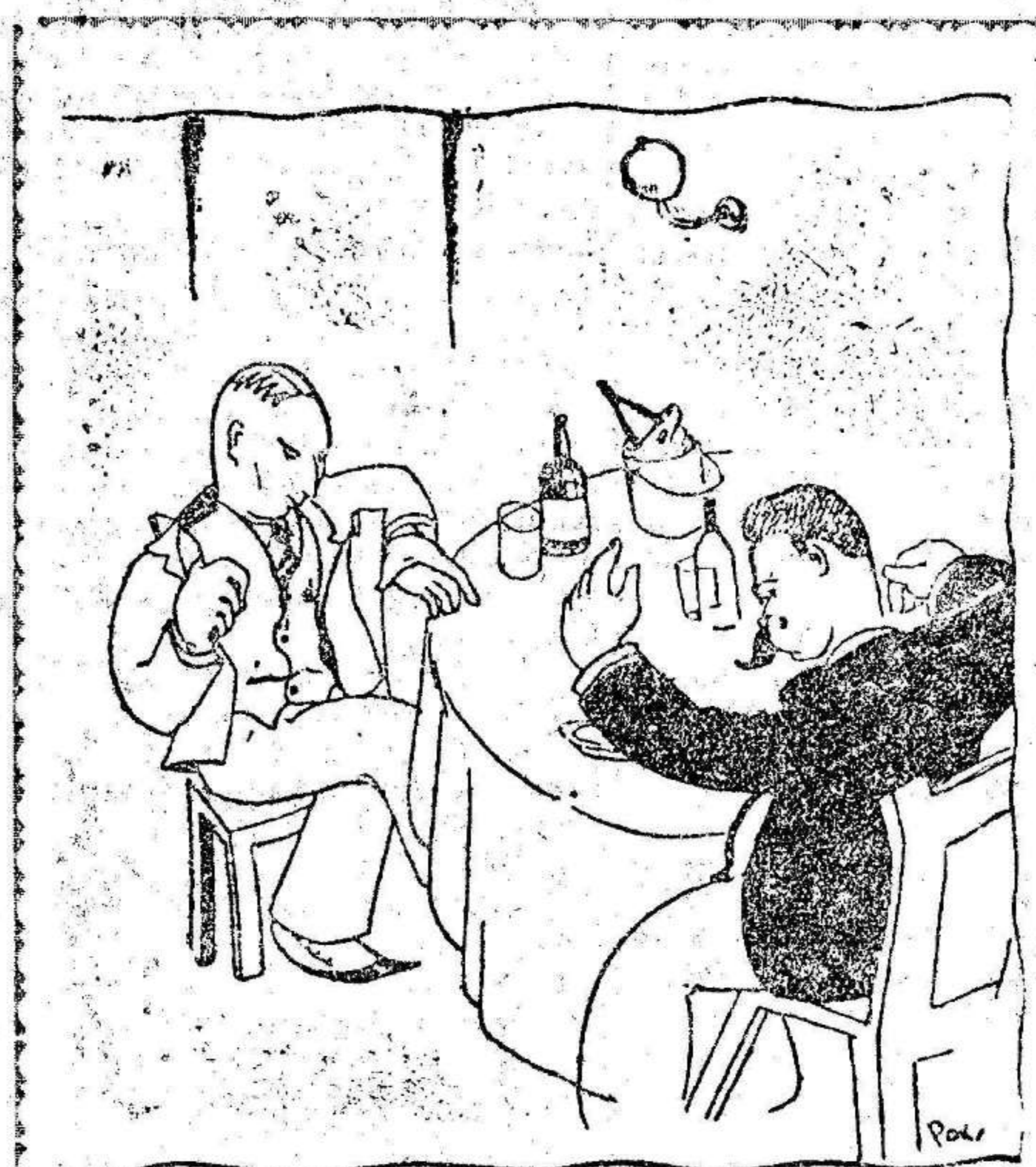
EL ANFITRION.—Mientras preparan la cena, dígame: ¿le gusta Tolstoi? EL NUEVO RICO.—Si tiene mucha cebolla, no, señor... («El Universal Gráfico».)

Suscríbese a EL LIBERAL 2 pesetas al mes