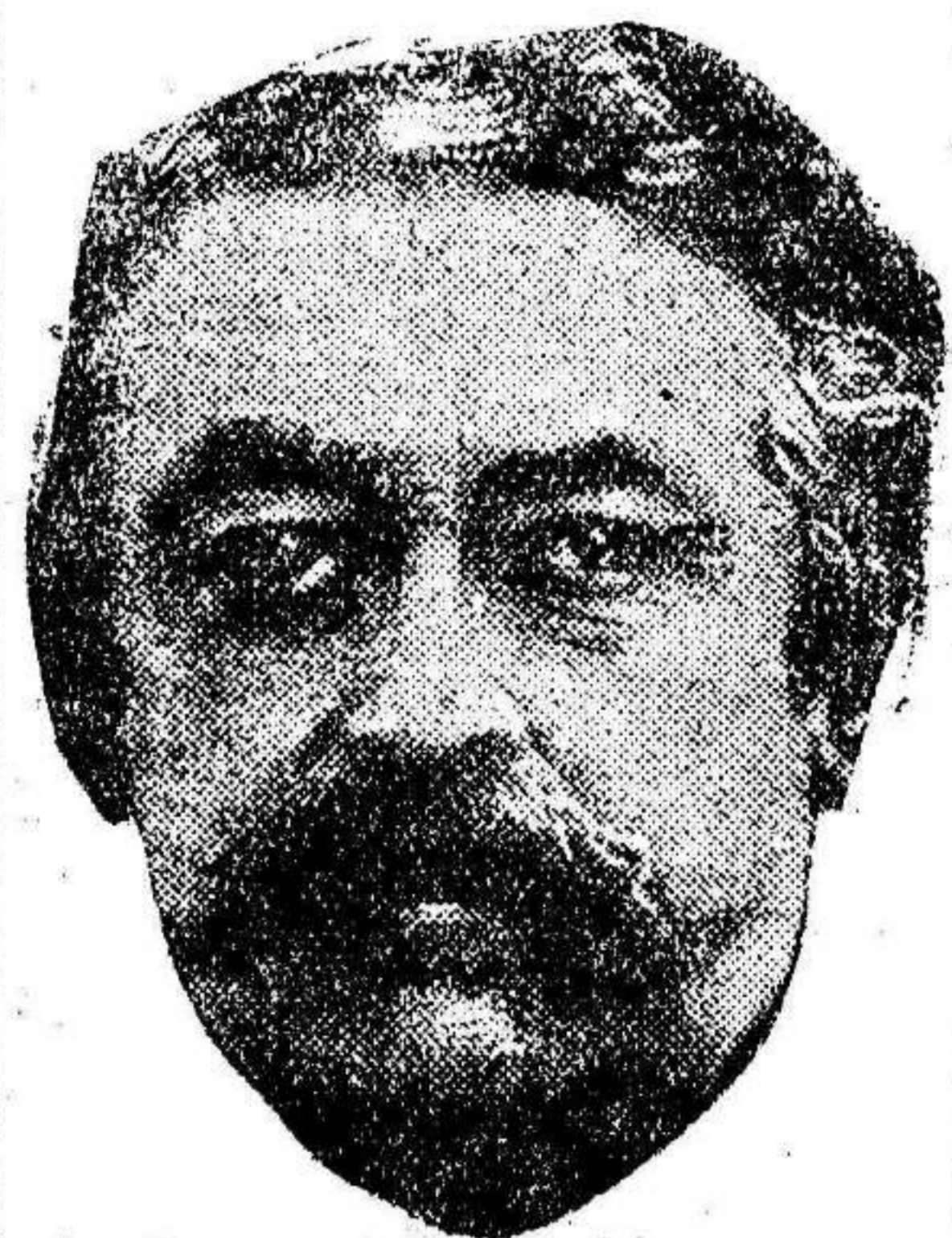
El señor Briand, jefe del Gobierno dimisionario francés.

vuelve a hacer uso de la pala-bra diciendo que el Gobierno tenía toda la confianza antes de comenzar las negociaciones de La Haya.