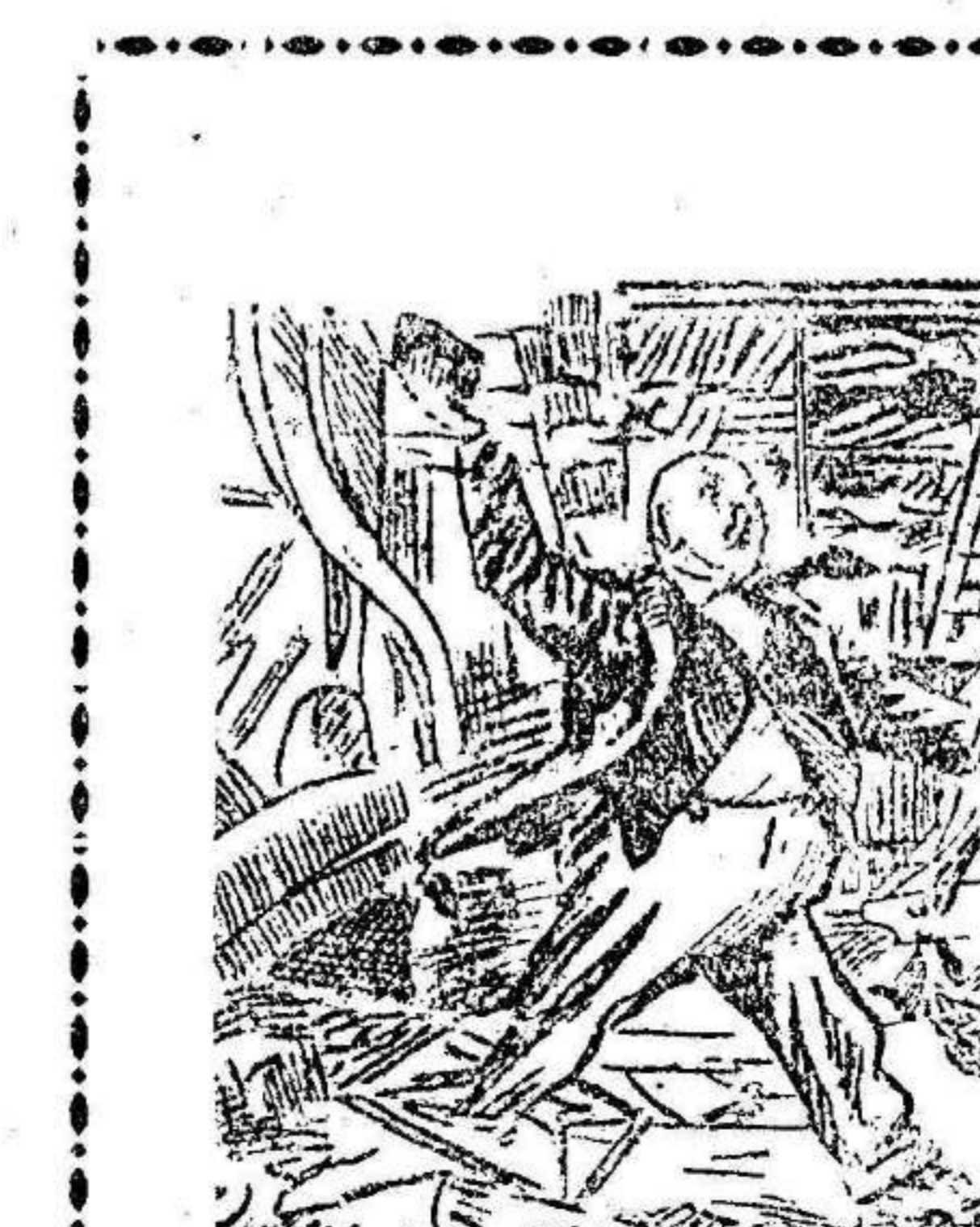
LA MADRE.—Querida, hubiera sido más económico hablarle de eso en el jardín.

Por el Estado Mayor han comenzado a repartirse las autorizaciones solicitadas por los periodistas para asistir a las sesiones del Consejo de guerra.