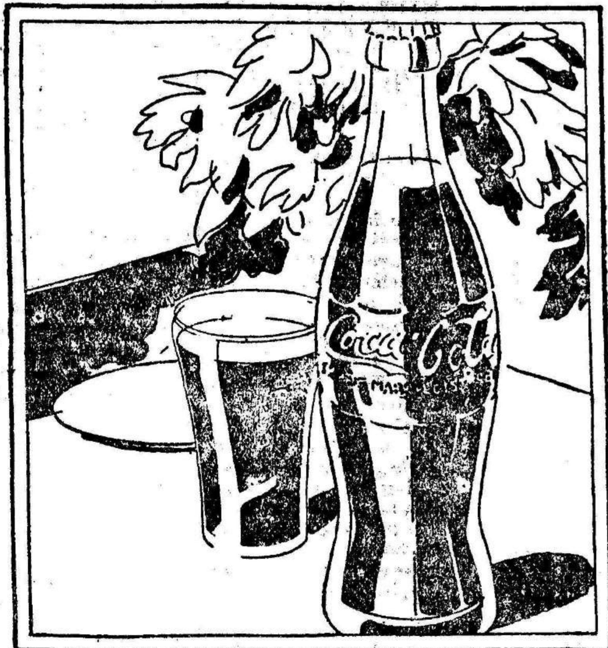
La bebida elegida por todos en los sitios más concurridos.