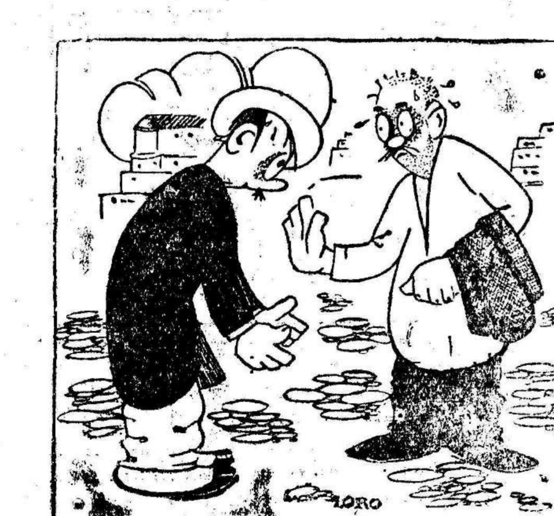
-Este calor ya no se aguanta. -¿Por qué no lloverá? -Pues porque el agua anda por las nubes...

Con mucha frecuencia recibimos anónimos rogándonos la publicación de determinadas noticias, quejas y hasta artículos literarios. Aunque en numerosas ocasiones no es precisamente el altruismo quien produce esas espontaneidades periodísticas, ya que suelen ser apasionadamente tendenciosas, hay algunos que revelan un noble interés. Los que acuden a nosotros en este sentido no deben obstinarse en el anónimo. Así es imposible atenderles. EL LIBERAL acoge con gusto cuanto pueda representar alguna aspiración legítima; pero es indispensable que se nos formule con la debida solvencia para evitar que sorprendan nuestra buena fe.