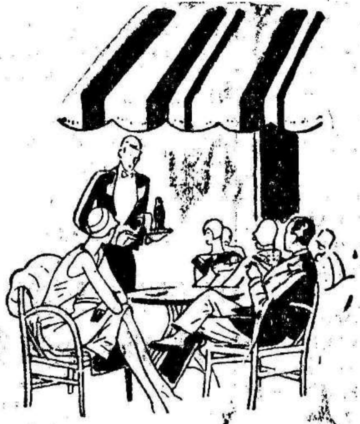
... en las terrazas de los bares elegantes...

Pídala hoy mismo. Le entusiasmará. De venta en todos los cafés y bares.