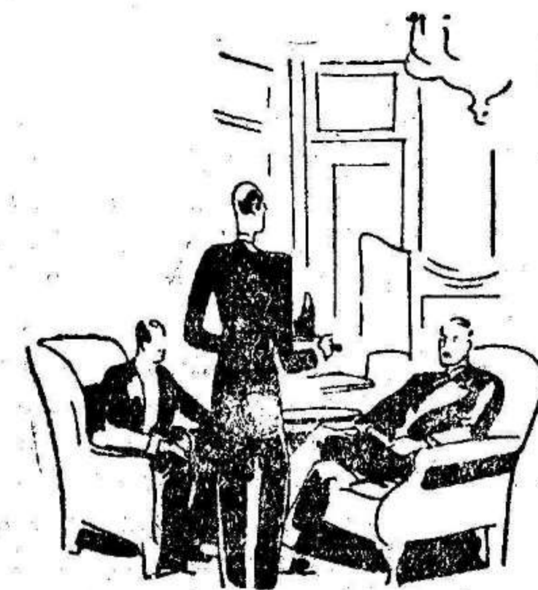
... en el club... ¡Coca-Cola es preferida siempre!