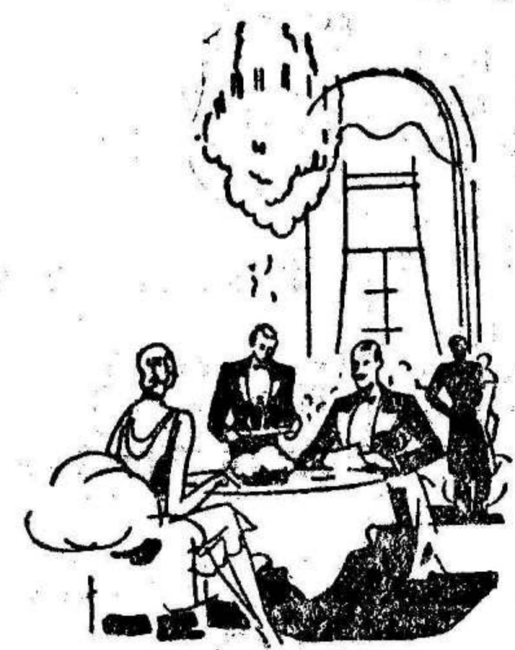
... al descansar de un rato de baile en el casino...