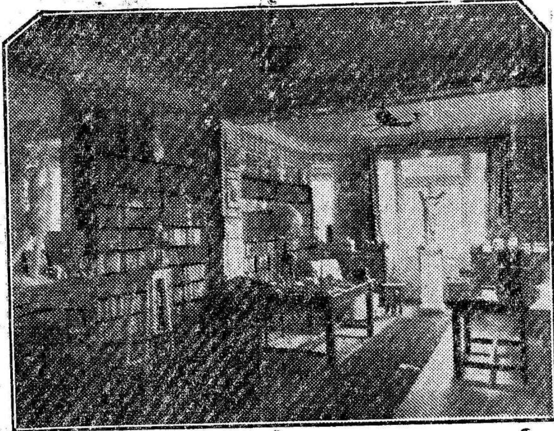
La biblioteca donde trabajaba el glorioso novelista