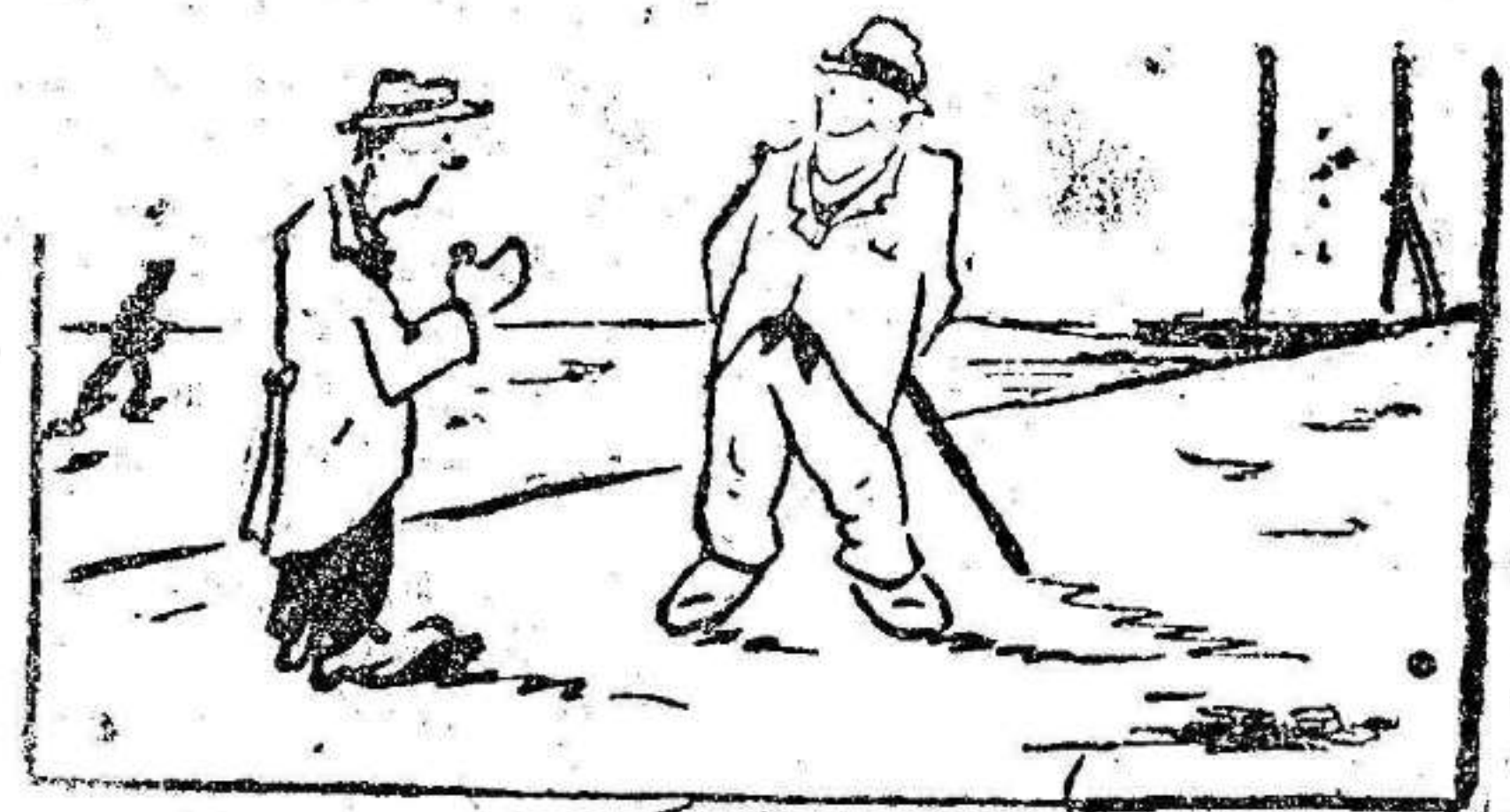
—Tranquílcese usted, vecino. Me he deshecho de la máquina de escribir. —¡Bien, hombre, bien! —Sí. La he cambiado por un gramófono...