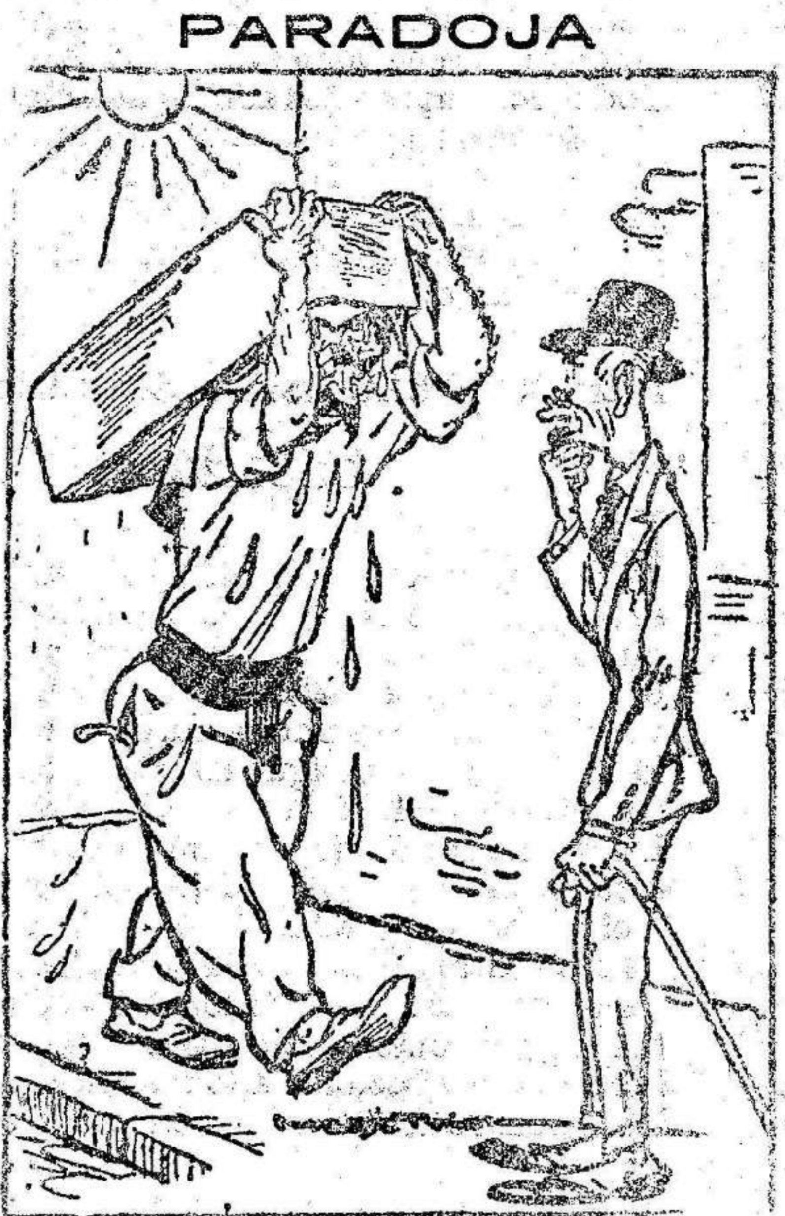
—¿Cómo suda usted, pobre hombre! ¿qué lleva usted ahí? —¡Hielo para refrescar!

LA PLUMA PREFERIDA EN CALIDAD Y PRECIO ES LA FONT-PELAYO Pedirla en todas las Papelerías