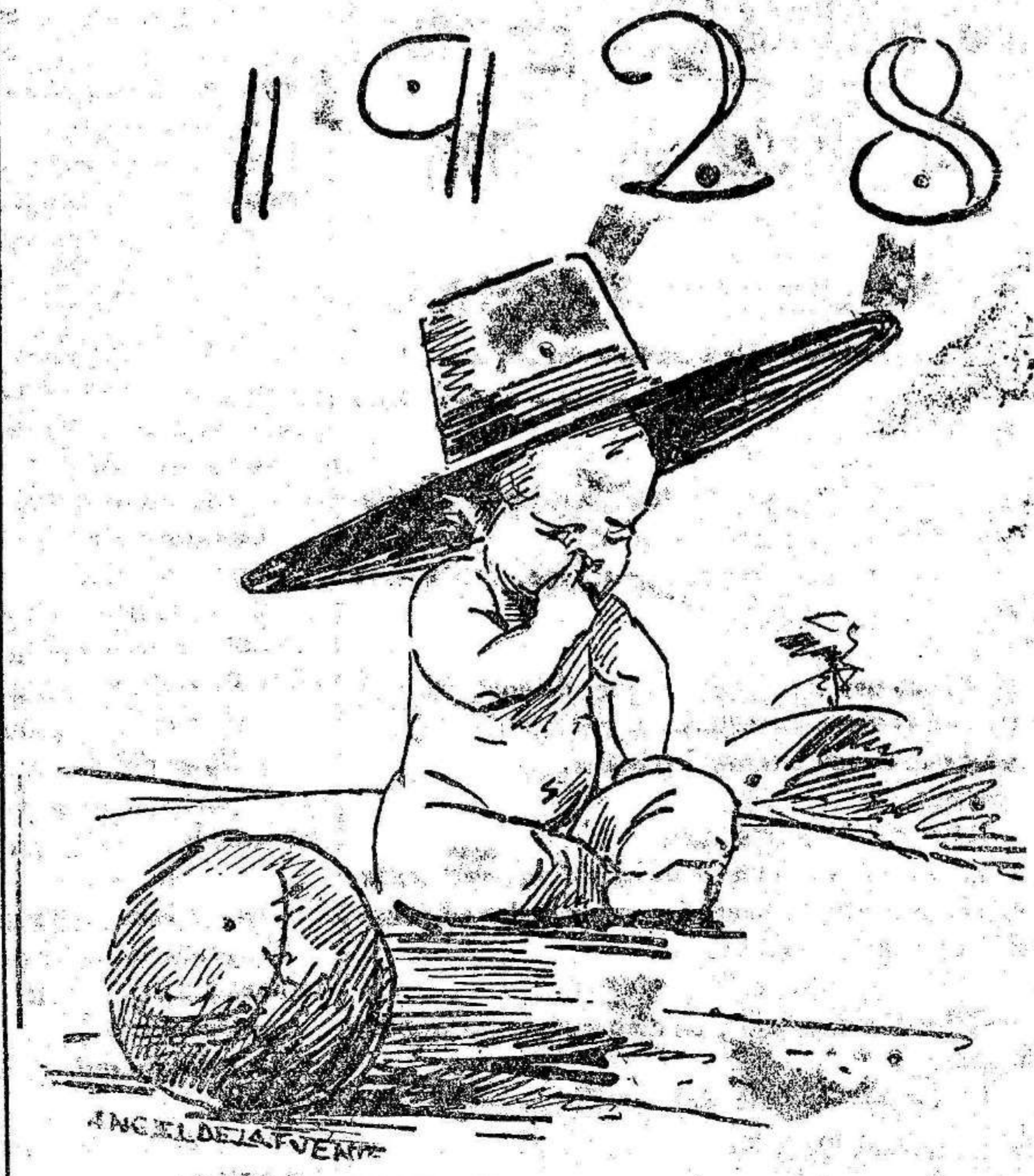
QUE ESTE SEA MEJORCITO