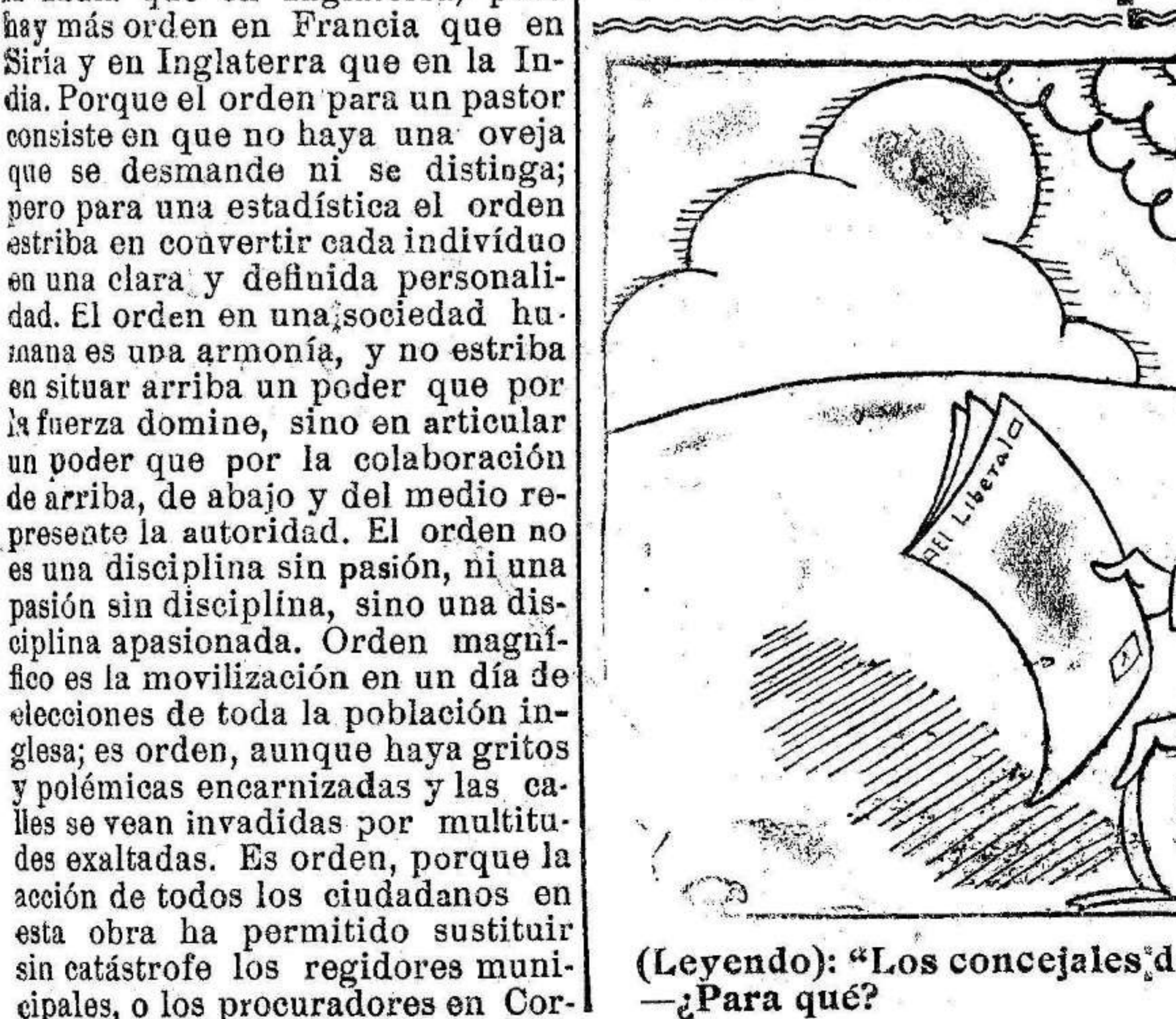
(Leyendo): «Los concejales deben ser elegidos por el pueblo.» —¿Para qué?

¿Que dónde hay una tiranía hay orden? Más silencio, más quietud hay en Siria que en Francia, y en la India que en Inglaterra; pero hay más orden en Francia que en Siria y en Inglaterra que en la India. Porque el orden para un pastor consiste en que no haya una oveja que se desmande ni se distinga; pero para una estadística el orden estriba en coartar cada individuo en una clara y definida personalidad. El orden en una sociedad humana es una armonía, y no estriba en situar arriba un poder que por la fuerza domine, sino en articular un poder que por la colaboración de arriba, de abajo y del medio represente la autoridad. El orden no es una disciplina sin pasión, ni una pasión sin disciplina, sino una disciplina apasionada. Orden magnífico es la movilización en un día de elecciones de toda la población inglesa; es orden, aunque haya gritos y polémicas encarnizadas y las calles se vean invadidas por multitudes exaltadas. Es orden, porque la acción de todos los ciudadanos en esta obra ha permitido sustituir sin catástrofe los regidores municipales, o los procuradores en Cor-