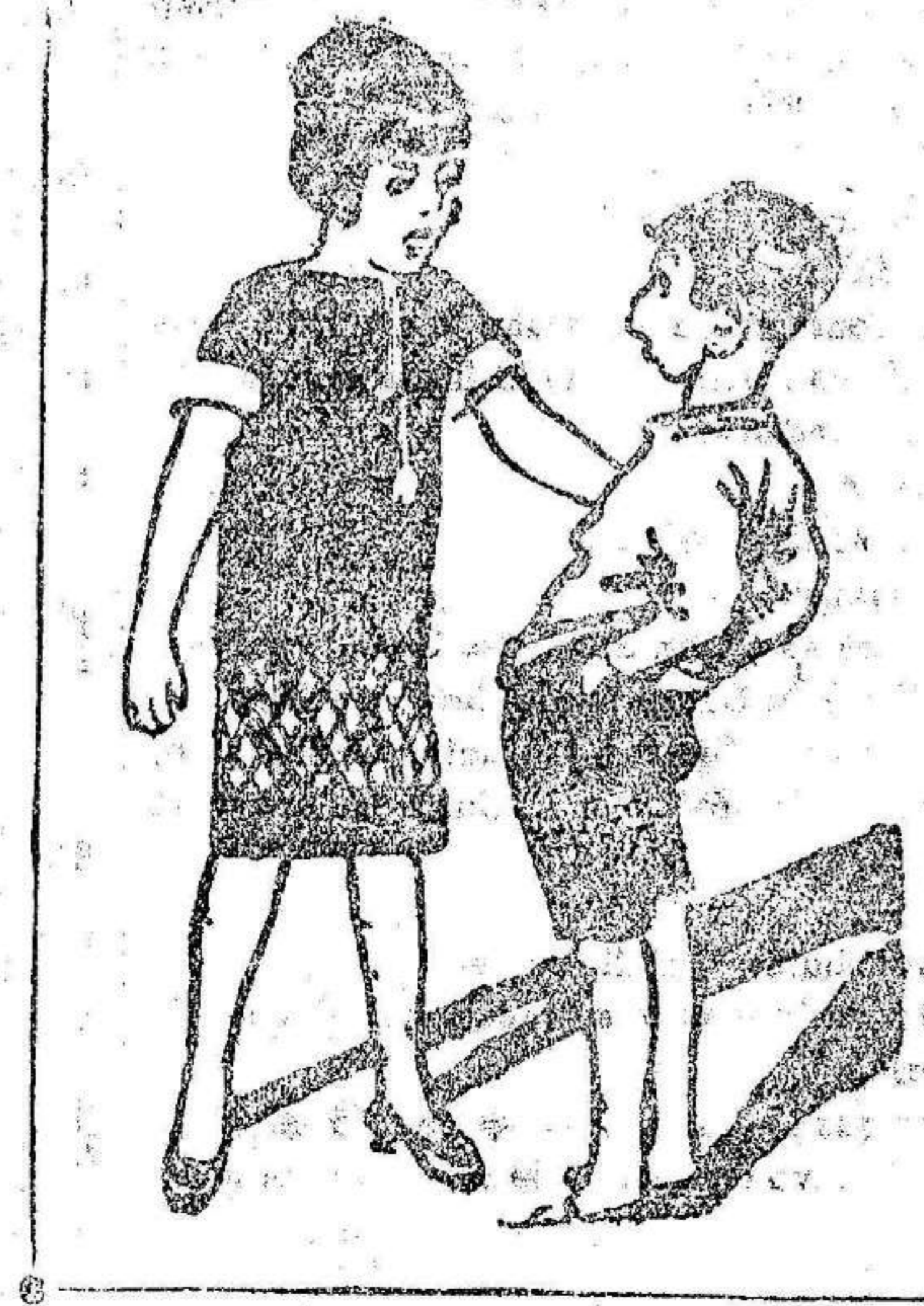
—Mi papá hace juguetes muy lindos. Y el tuyo, ¿qué hace? —Pues hace lo que mamá le manda..., y cuidado con que rechiste.