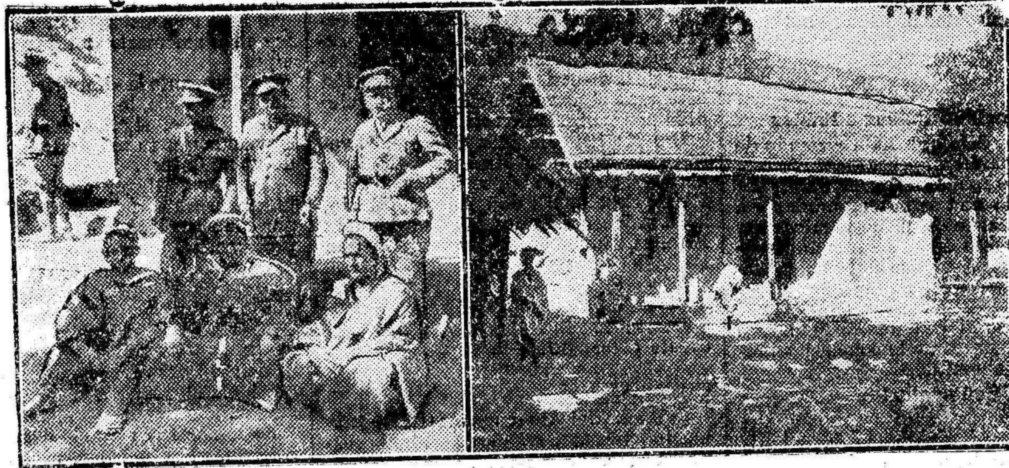
Sanjurjo, Goded y Castro Girona, en su viaje por tierra desde la zona occidental a la oriental, bordeando la frontera que divide los protectorados de Francia y España, han recibido pletesta de importantes cañes y jefes guerreros. Los de Sarair consintieron posar ante los objetivos fotográficos. A la derecha: La zaula de Ketama en nada se asemeja a las zaulas de las demás cabilas del Rif. Con sus tejados en vertical y su porche andaluz, tiene todo el aire de una casa de campo española. Y, sin embargo, a su sombra se ha sostenido, hasta hace pocos días, el foco antiespañol más importante.