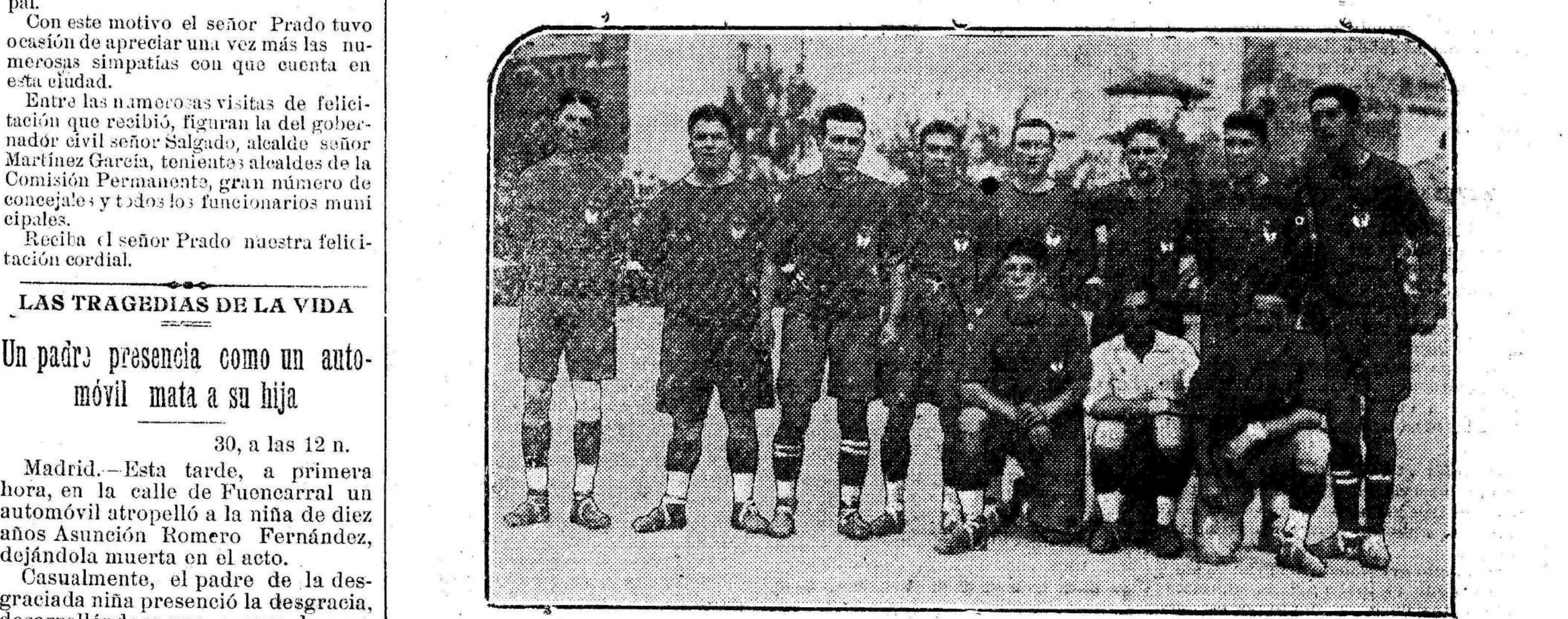
El equipo del Unión, que tan brillantemente venció al Racing en el partido del domingo