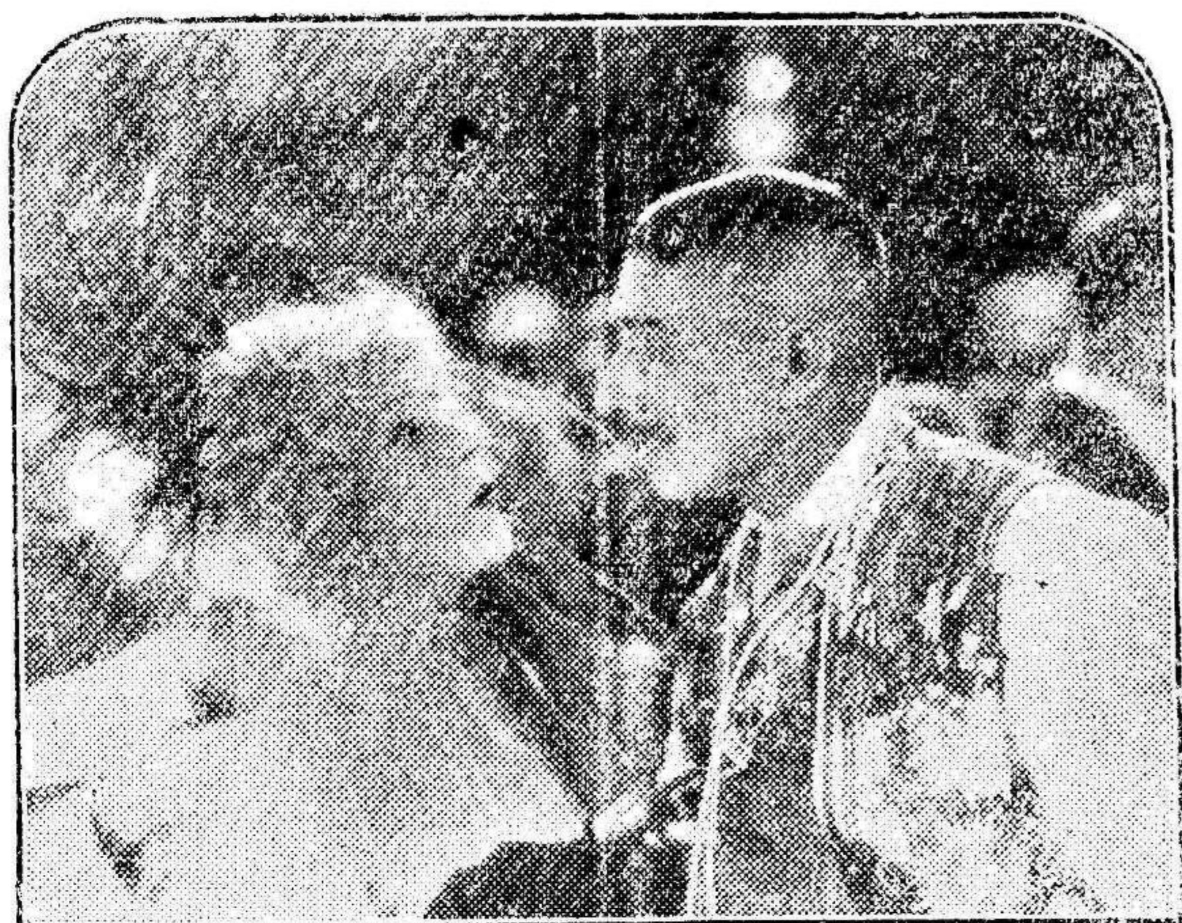
Mae Murray and John Gilbert en una interesante escena de la nueva película de la Metro Goldwyn «La Vida alegre».