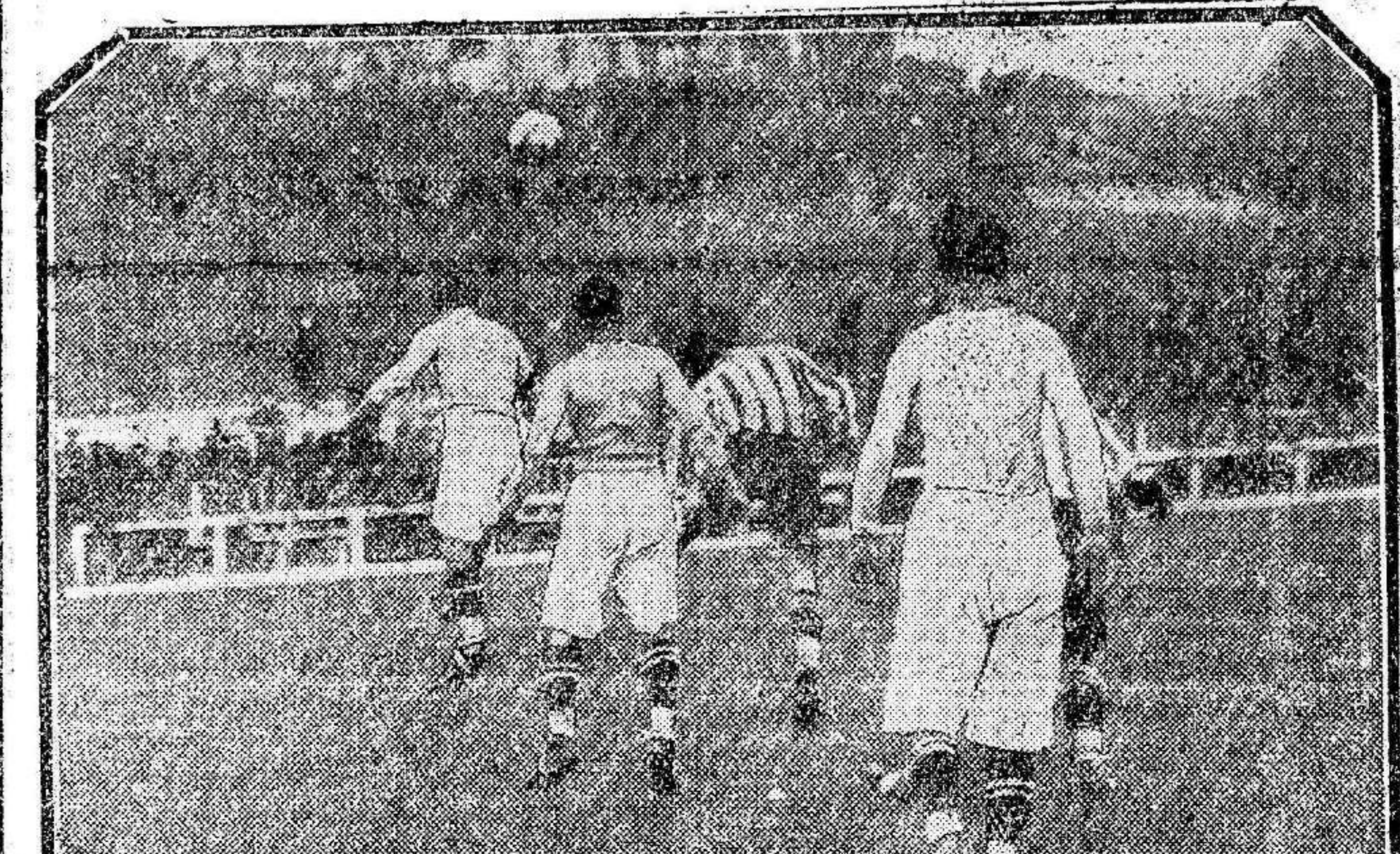
Un momento del partido Celta de Vigo y Athletic de Madrid celebrado el domingo último en Madrid.