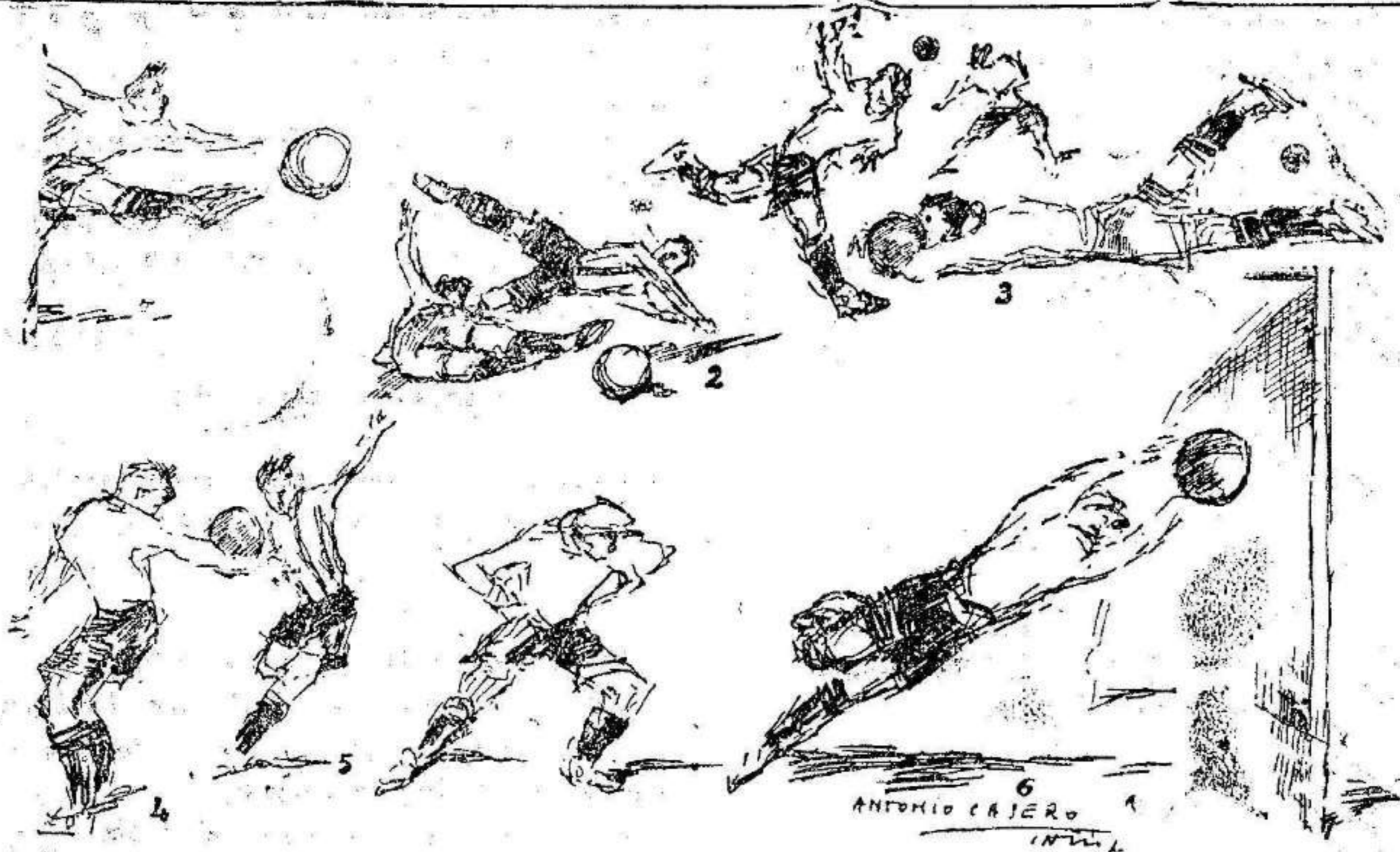
Paeiro.—Paga, el formidable extremo izquierdo del Racing de Santander.—Segundo. U de las muchas caídas de la tarde.—Tercero. El guardameta del Racing madrileño, sacando un balón de los pies de sus contrarios.—Cuarto. Una «mano» de un jugador santanderino.—Quinto y sexto. Dos momentos del guardameta norteño en el penalty que paró de magistral manera.

Parce que ahora va a realizarse ese proyecto y que en breve visitará don Alfonso nuestra población para imponer la Medalla militar a la bandera del bravo regimiento de Sevilla.