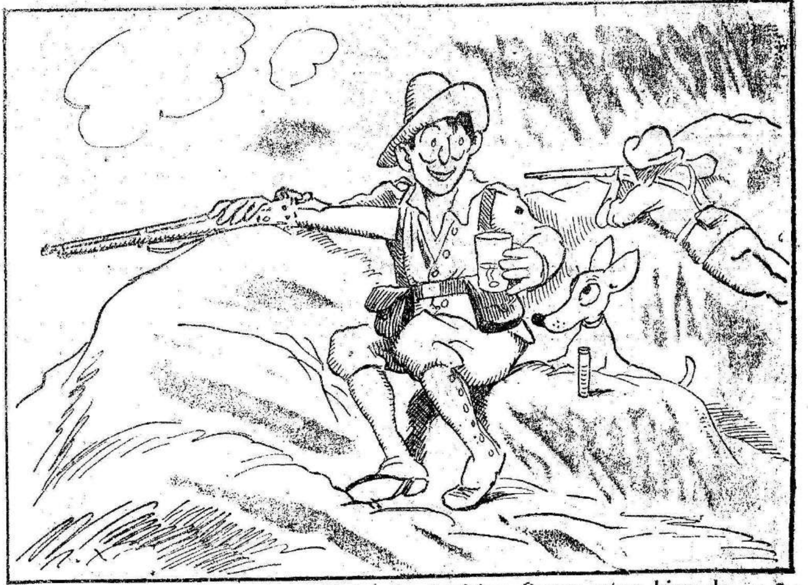
El soldado - Con estas tabletas de Aspirina Bayer estoy bien defendido... El perrito - ...gracias a tu madrina de guerra...

un piso independiente en el Hotel recientemente construido en el paseo del Malecón frente al Huerto de los Cipreses. También alquilase los bajos de dicho Hotel para almacenes, talleres, garage, etc.