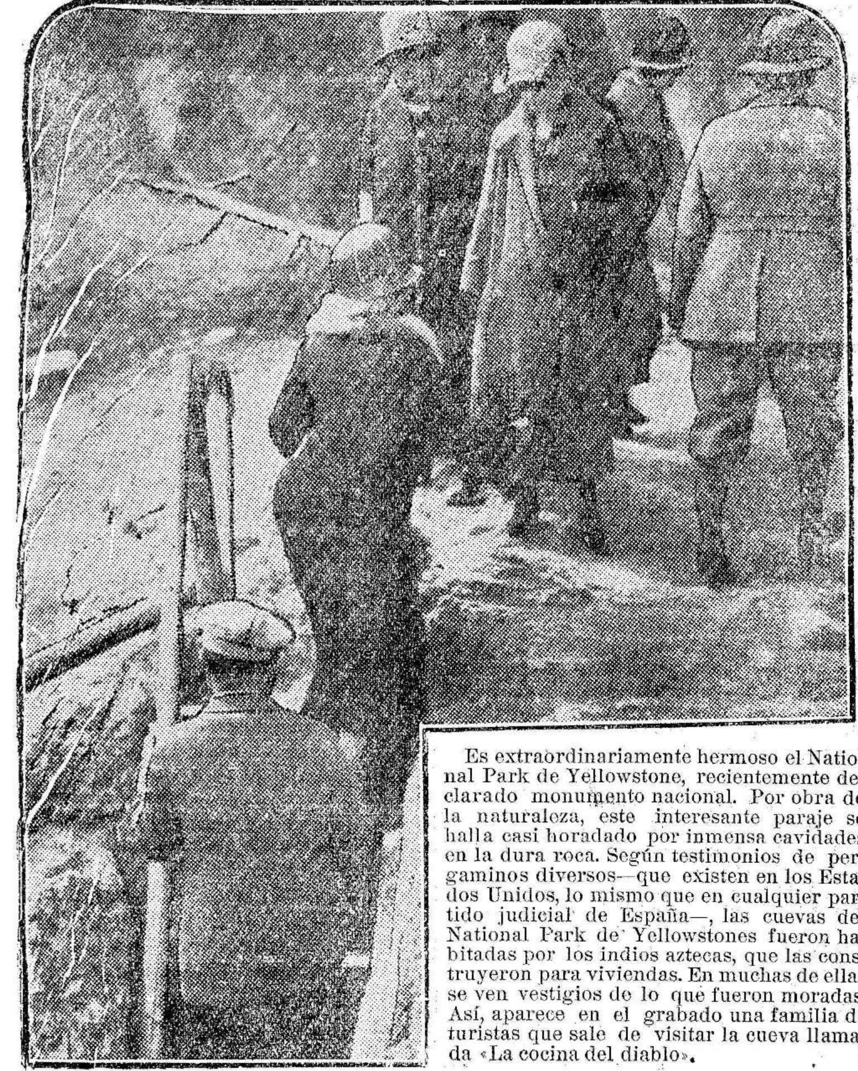
Es extraordinariamente hermoso el National Park de Yellowstone, recientemente declarado monumento nacional. Por obra de la naturaleza, este interesante paisaje se halla casi horadado por inmensas cavidades en la dura roca. Según testimonios de peregrinos diversos—que existen en los Estados Unidos, lo mismo que en cualquier partido judicial de España—, las cuevas del National Park de Yellowstone fueron habitadas por los indios aztecas, que las construyeron para viviendas. En muchas de ellas se ven vestigios de lo que fueron moradas. Así, aparece en el grabado una familia de turistas que sale de visitar la cueva llamada «La cocina del diablo».