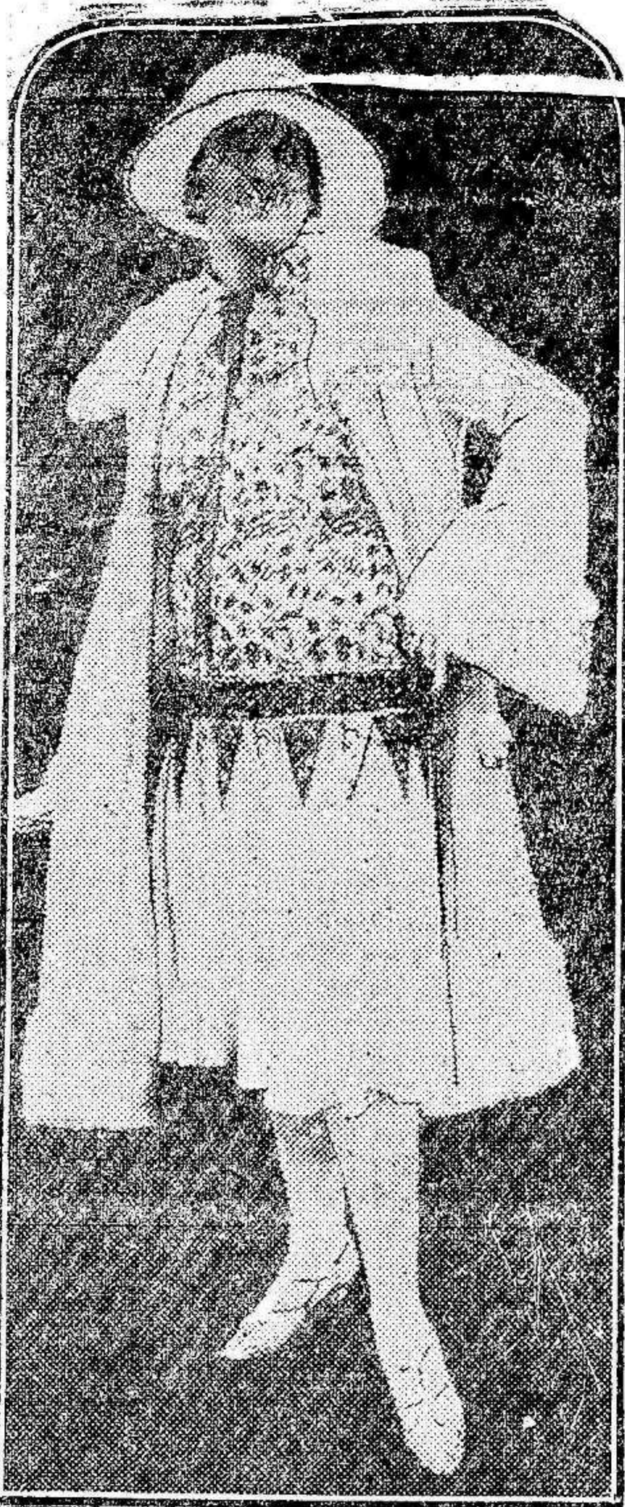
Una de las últimas creaciones femeninas para la temporada actual. El fondo blanco del vestido da a la belleza de la modelo ricos atractivos alegres