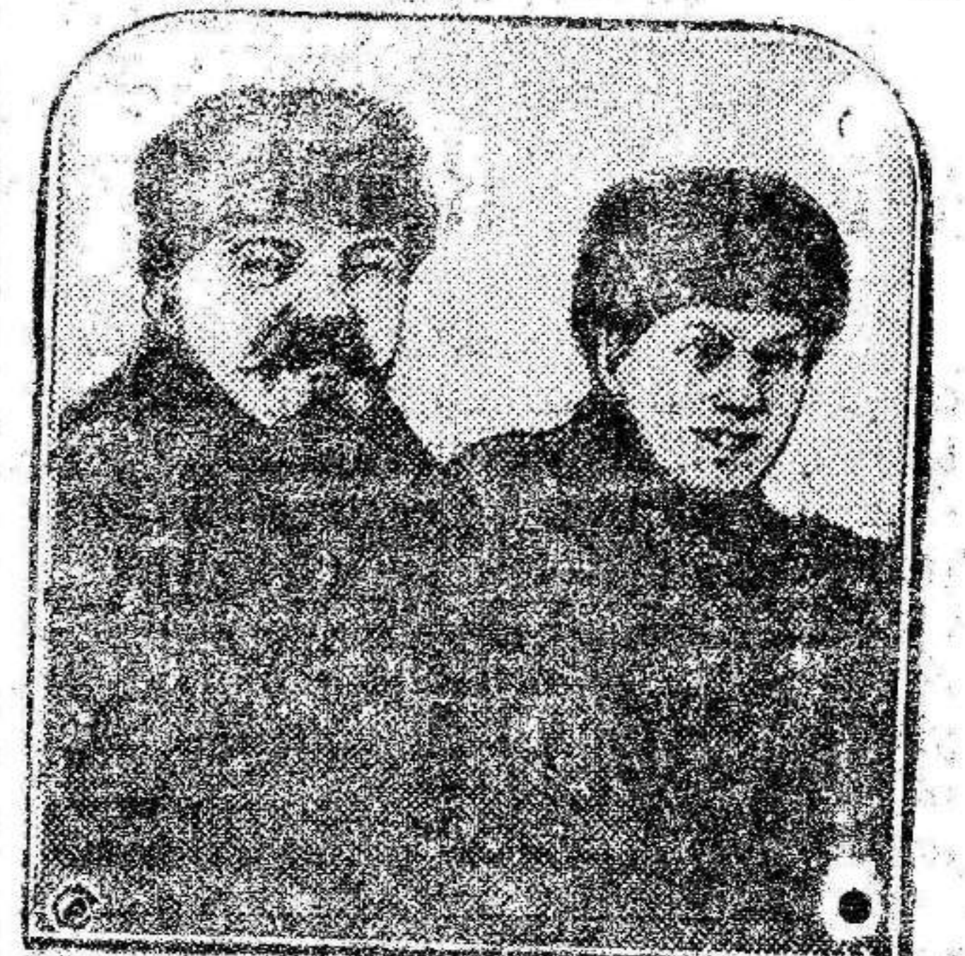
Un de los últimos retratos de Lenin, acompañado de su esposa.

5, a las 6 t. Vigo.—Esta mañana fonó en este puerto el vapor inglés «Obita» Trajo a bordo cuatr-cientos turistas que proceden de Tángier. En tren especial marcharon todos a primera hora de la tarde a Santiago de Compostela.