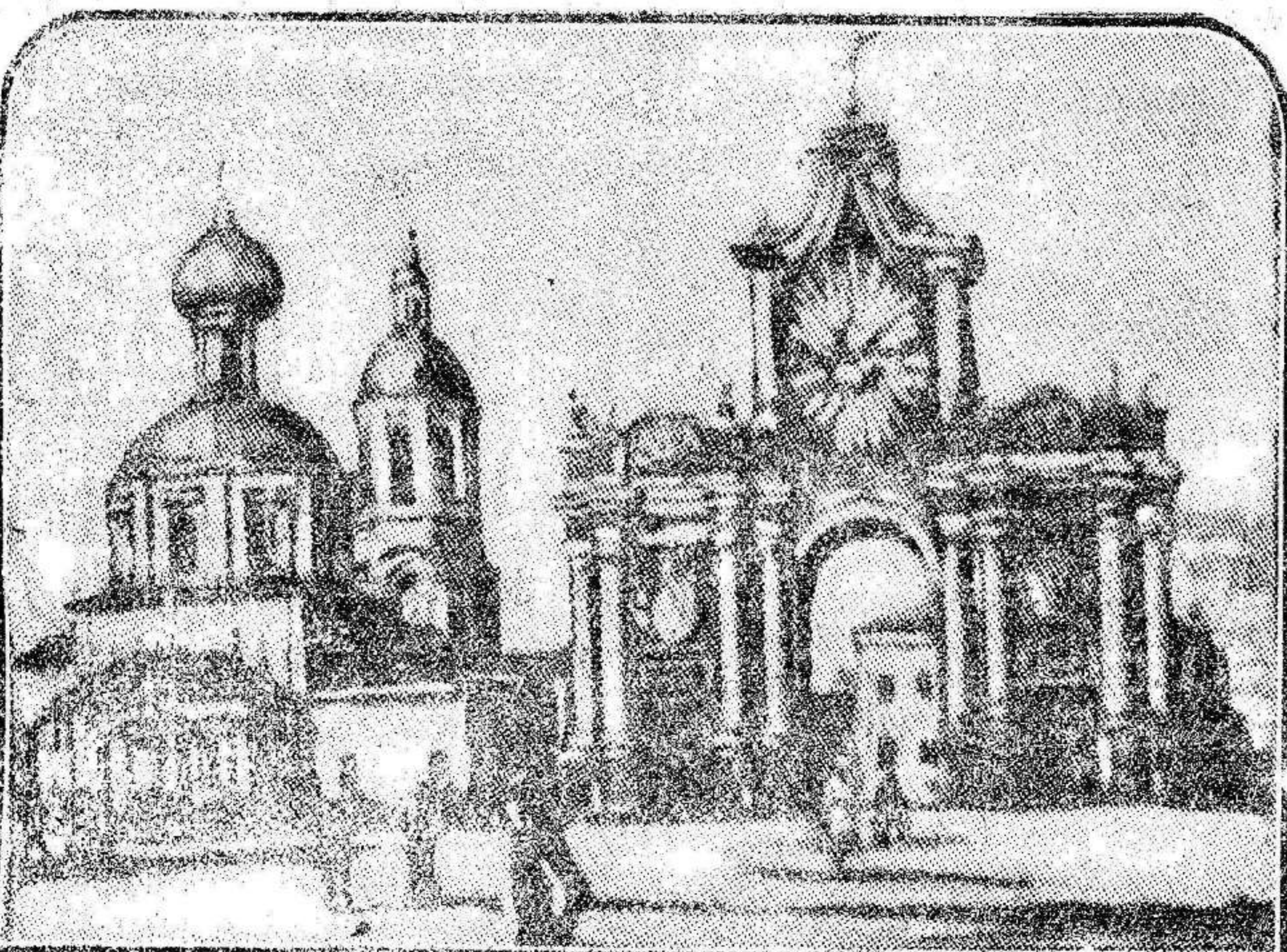
La puerta de la plaza Roja, en el Kremlin, donde fué inhumado el cadáver del zar rojo, ante el monumento erigido en honor de los muertos de la revolución