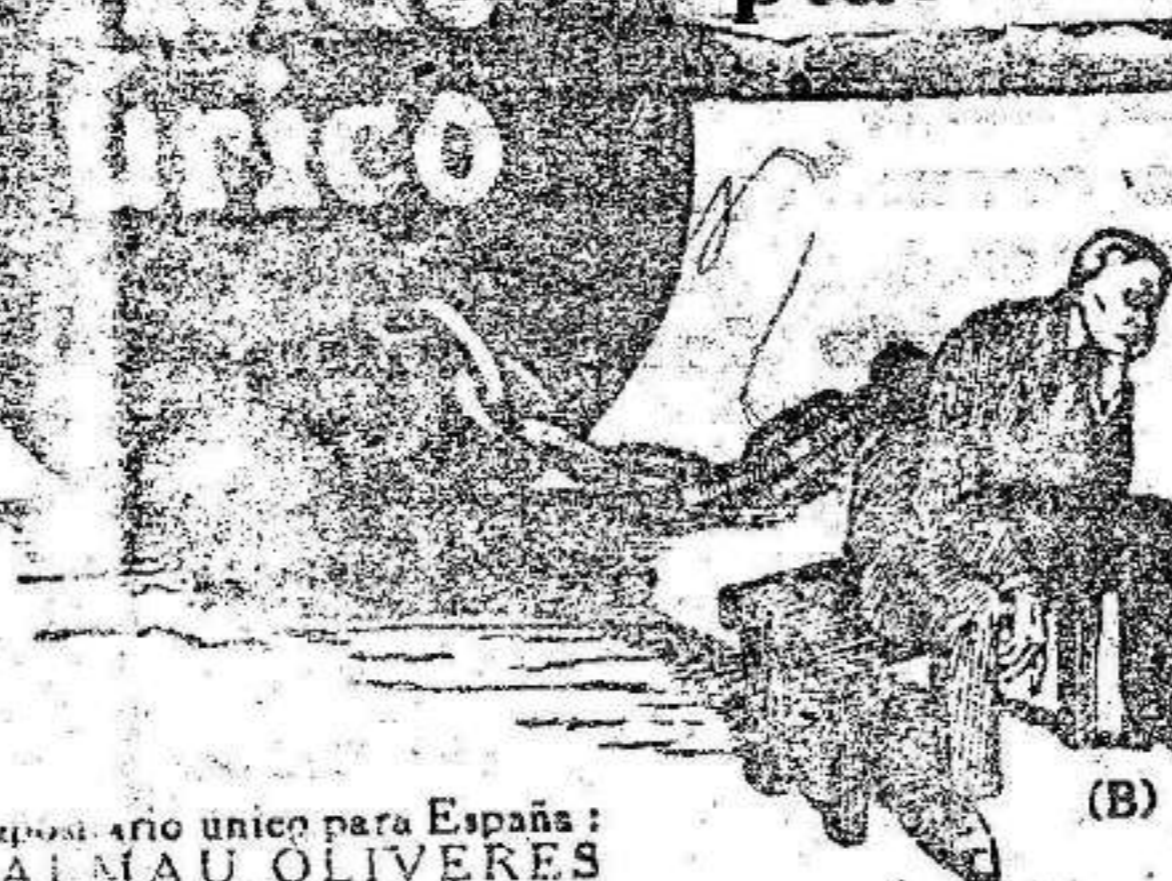
Deposito unico para España: CALMAU OLIVERES, P. de la Industria, 14 BARCELONA y en todas las buenas farmacias y almacenes.

REUMATISMOS, GOTA, PIEDRA. La caja de 12 paquetes para hacer 12 litros de agua mineral: ptas 1'20