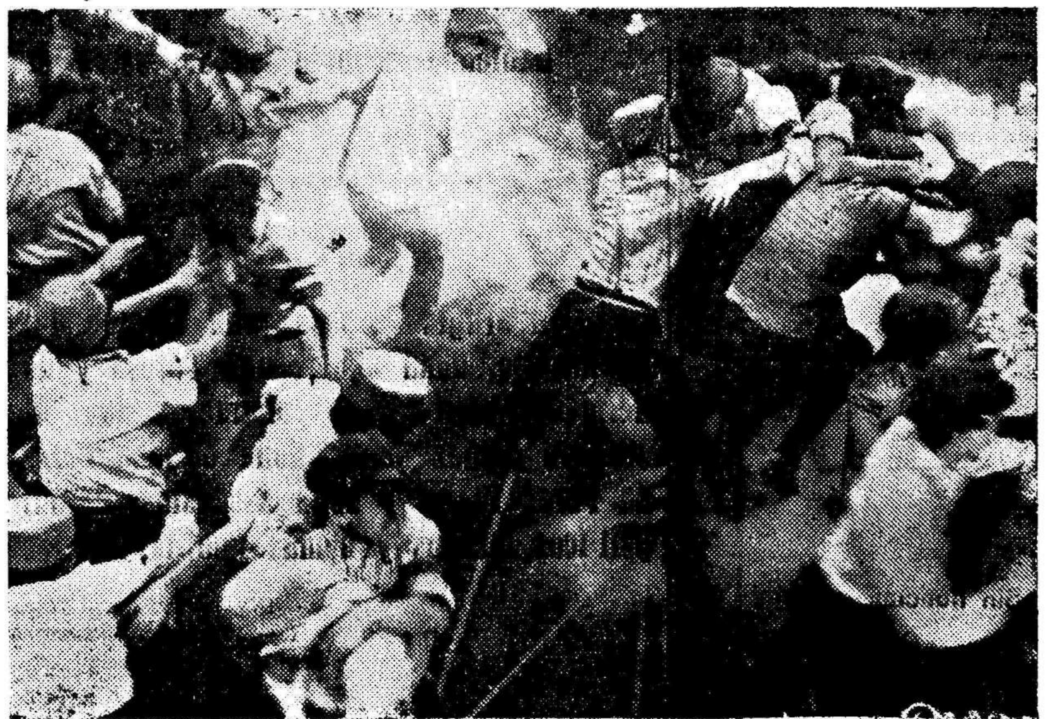
Una emocionante escena de film de CIFESA titulada HOMBRES DEL MAÑANA

El fotodrama se debe a la experta pluma de Jo Swerling, basado en la novela corta «Jailbreaker» (El Evadido) de W. R. Burnett. Jean Arthur hace de «partenaire» y la dirección estuvo a cargo del hábil realizador John Ford.