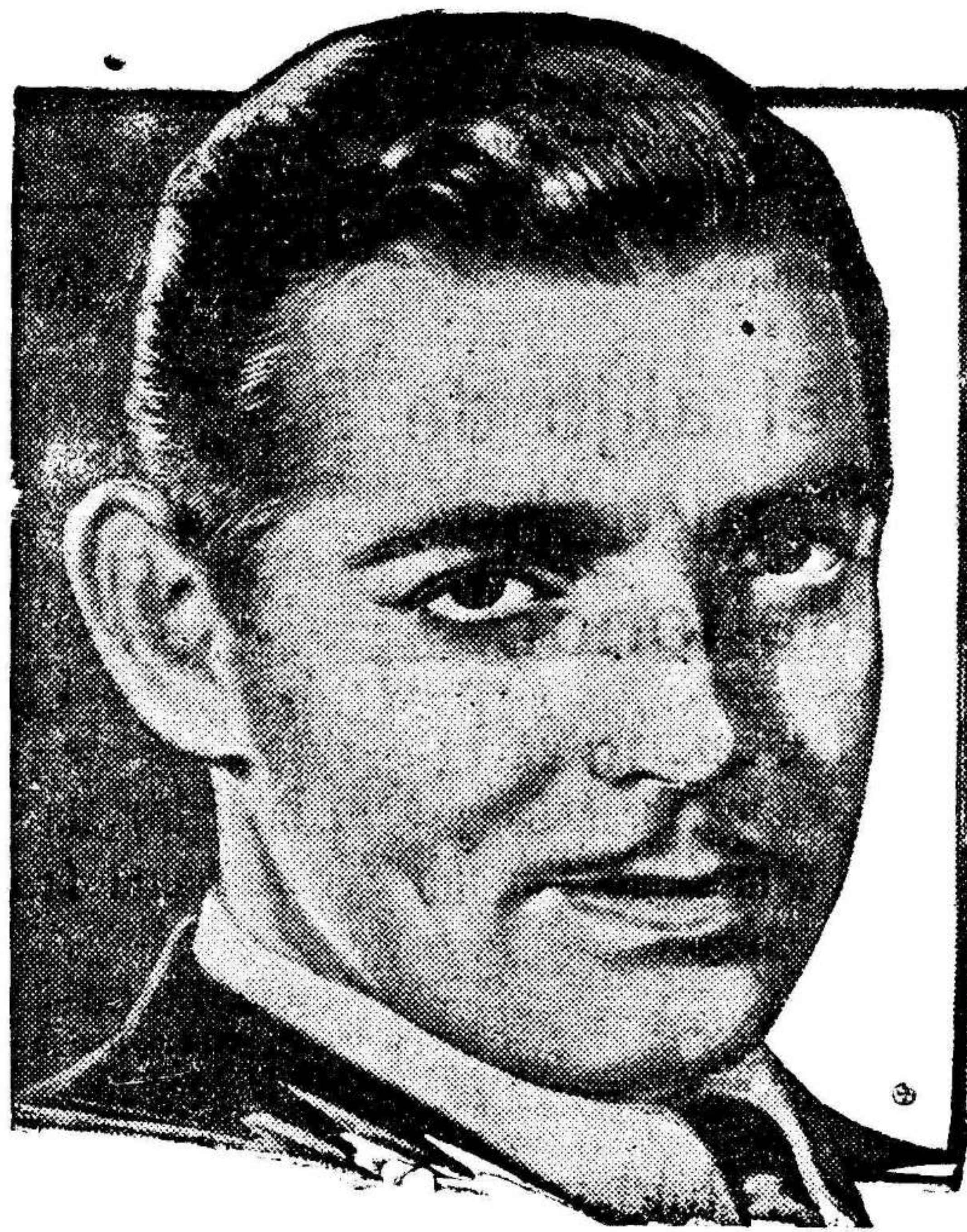
Clark Gable, el admirado galán que actúa en el film Columbia SUCEDIÓ UNA NOCHE, que distribuye CIFESA

Los trabajos, se recuerda a los concursantes, deben dirigirse bajo sobre cerrado a la dirección siguiente: «C. I. F. E. S. A. Sección Producción. Avenida de Eduardo Dato, 34, Madrid», haciendo constar en el mismo sobre del envío la inscripción: «Para el concurso de argumentos».