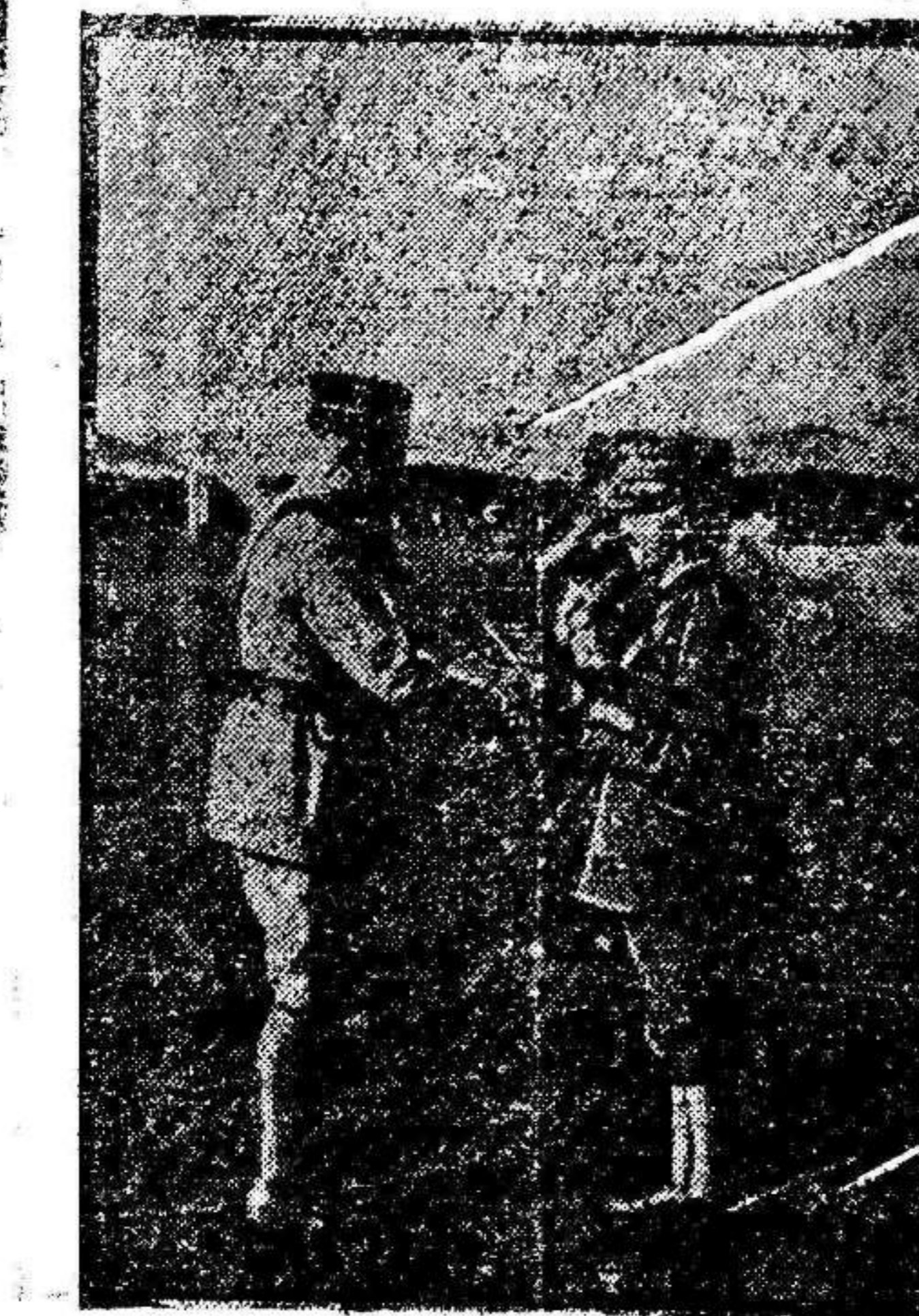
El rey de Italia condecorando al general Pettain.