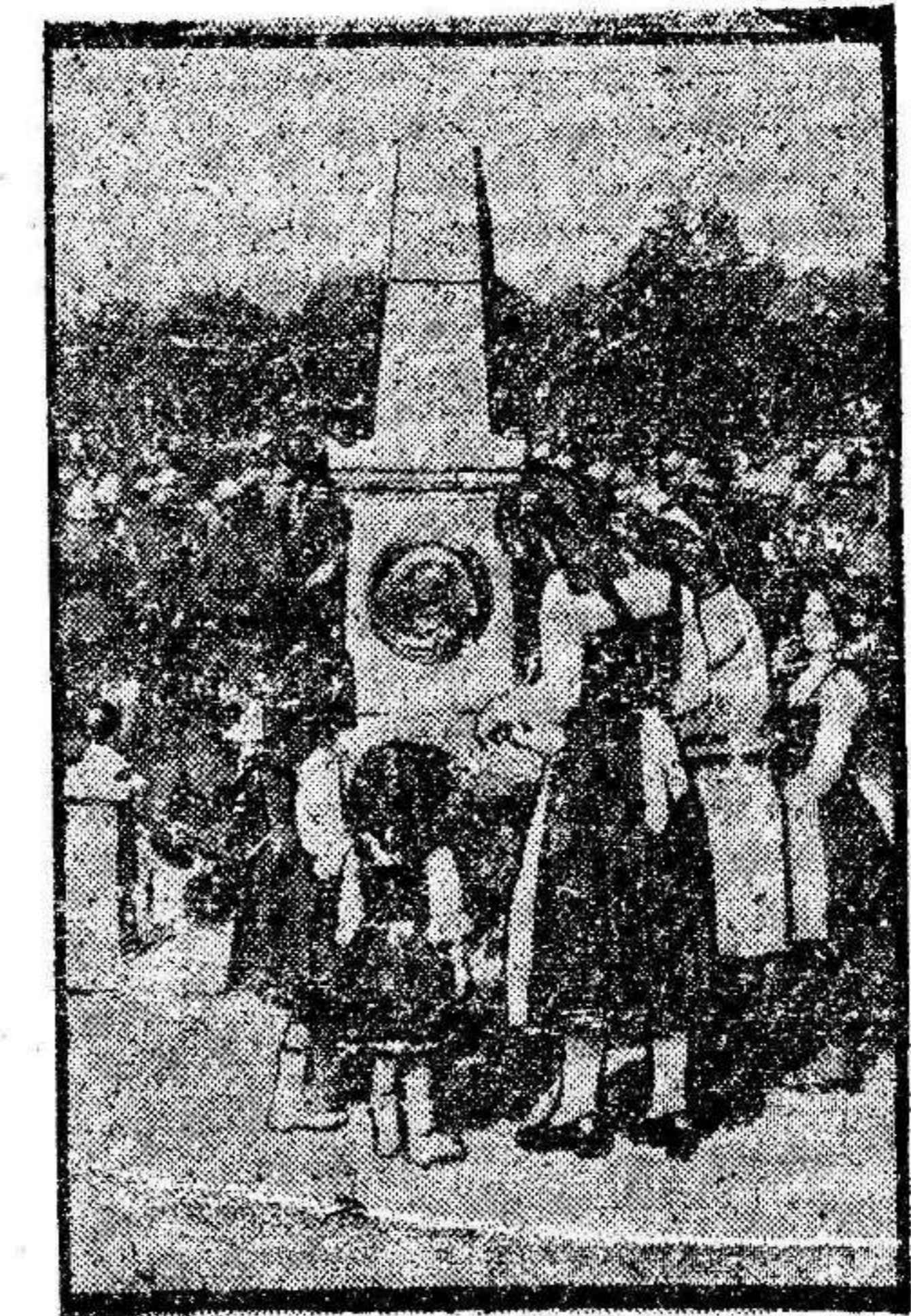
Inauguración del monumento a Eugenio en Petit Croix