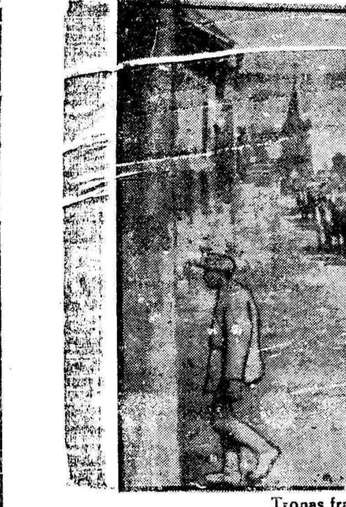
Tropas francesas entrando en un pueblo reconquistado a los alemanes