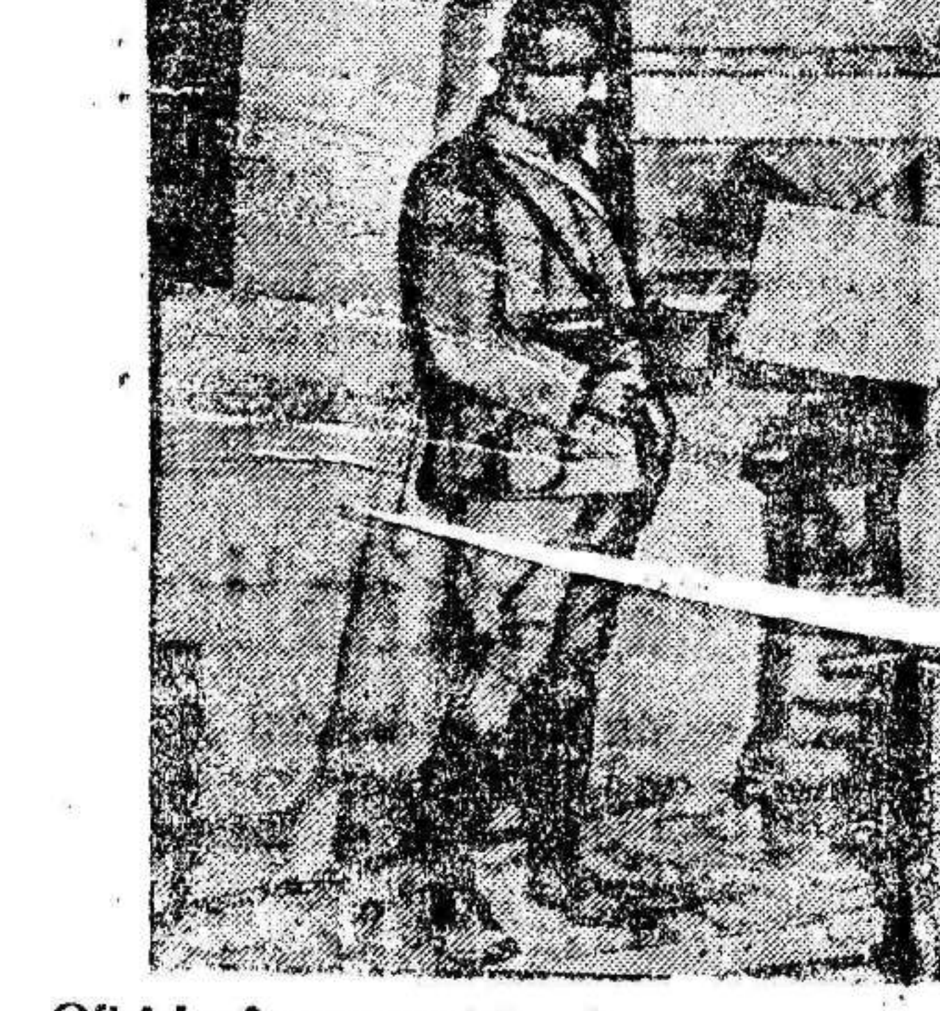
Oficiales franceses visitando una casa saqueada por los alemanes.

El maestro de taller de terocera clase del Parque de la comandancia