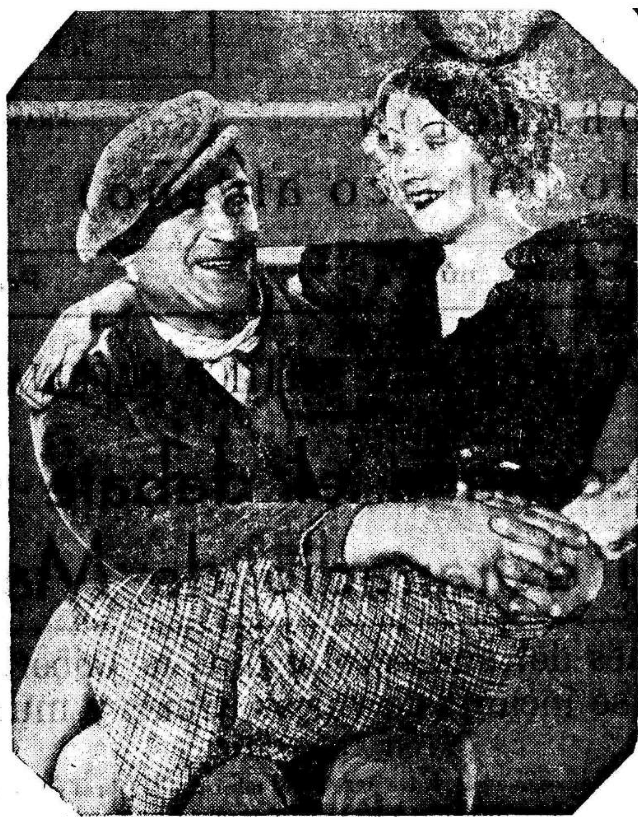
Victor Mac Lagren y Heather Angel, intérpretes de la famosa película Radio film, EL DELATOR, que ha valido al primero el premio de la mejor interpretación del año, y a su director John Ford el premio correspondiente a la mejor dirección. Esta película se estrena el domingo próximo en el Circo.