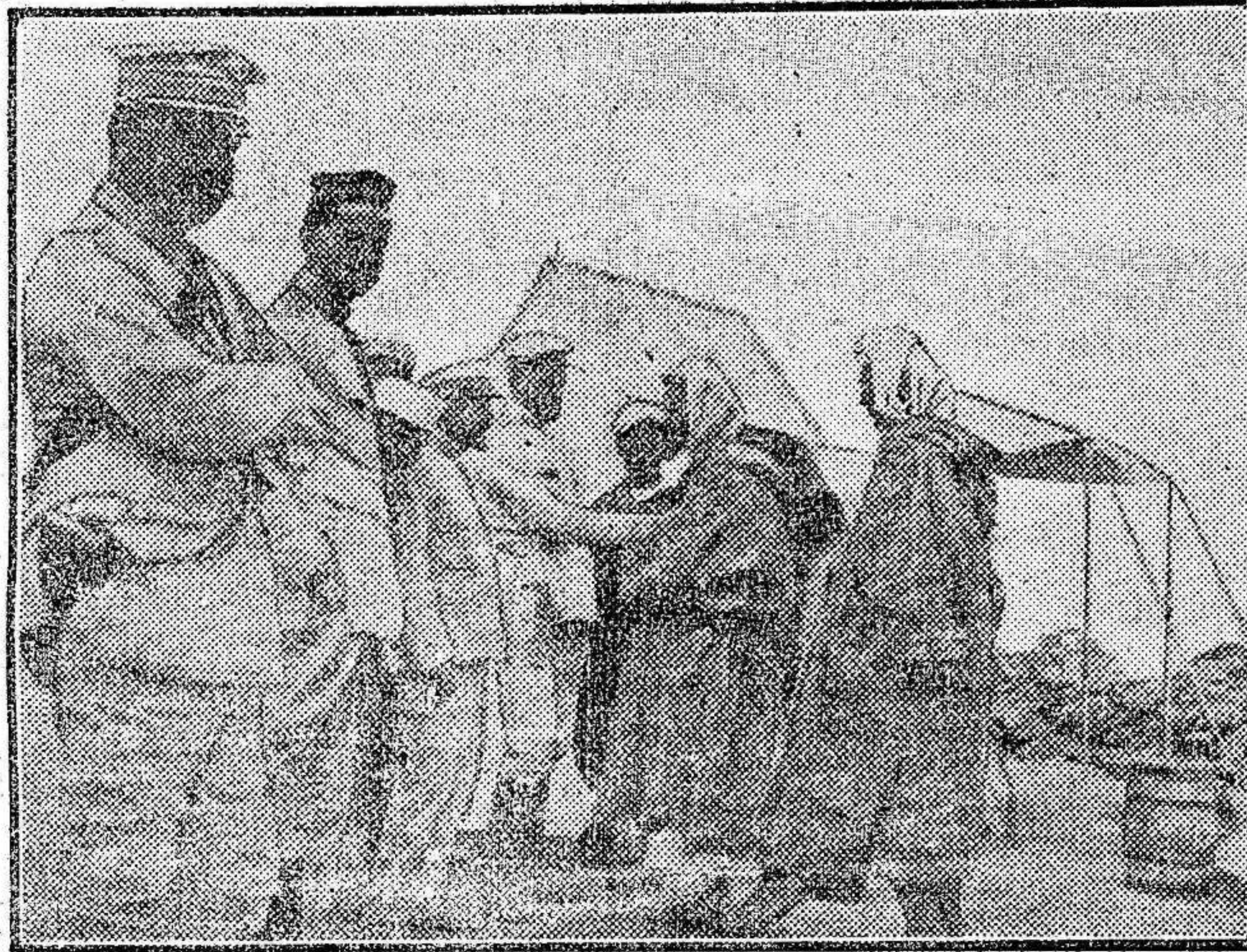
Oficiales españoles interrogando á dos moros detenidos en las cercanías del campamento del Hipódromo en Melilla.

para las fuerzas de Madrid que llegarán hoy.