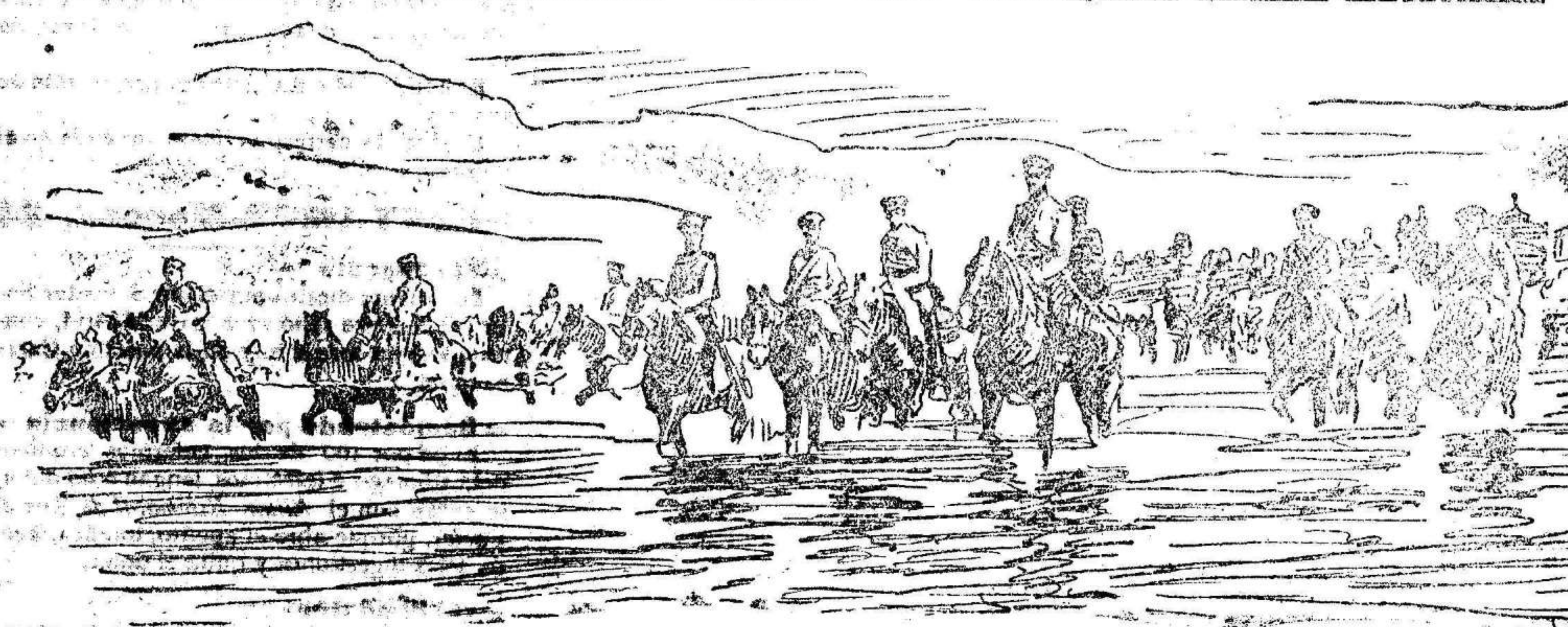
LA ARTILLERIA RUSA PASANDO EL RIO TAI TSE