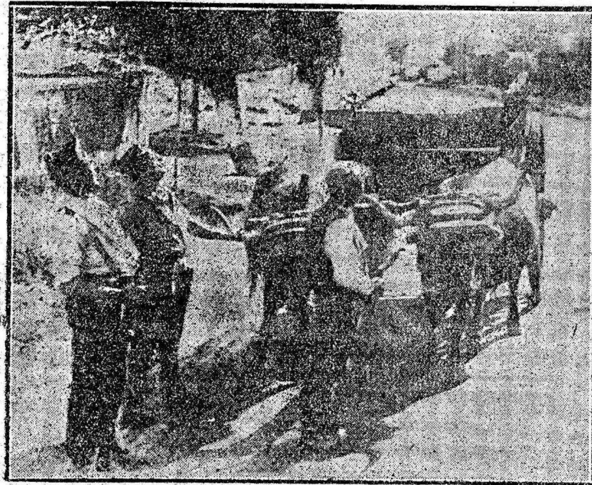
Observando las evoluciones de un avión.

También se les pide una cantidad por la responsabilidad civil contractual, cuya cantidad asciende a diez mil pesetas.—Febus.