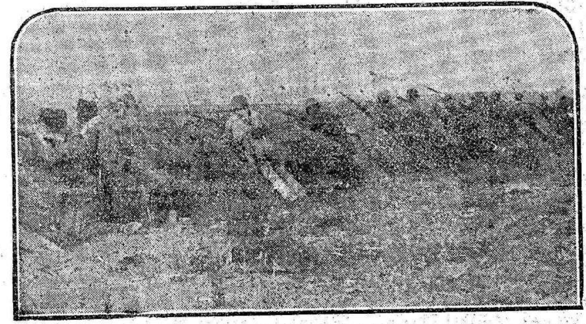
EN EL FRENTE DEL CENTRO.—En el frente del Centro se combate a estas horas duramente.

También destacó el general Asensio a un cabo de Asalto llamado Mayordomo, que con veinte hombres ha hecho retroceder a una columna rebelde.