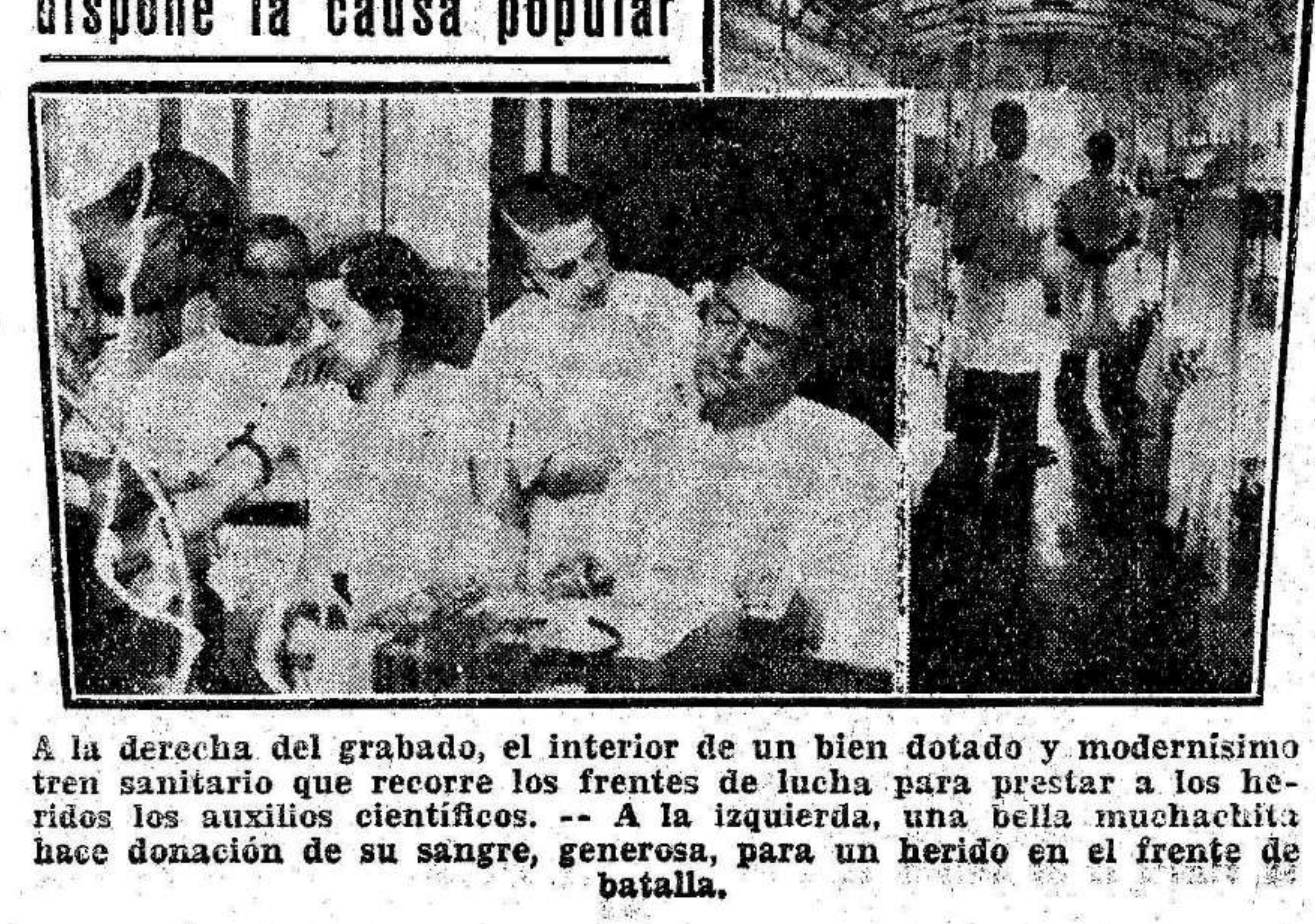
A la derecha del grabado, el interior de un bien dotado y modernísimo tren sanitario que recorre los frentes de lucha para prestar a los heridos los auxilios científicos. -- A la izquierda, una bella muchachita hace donación de su sangre, generosa, para un herido en el frente de batalla.