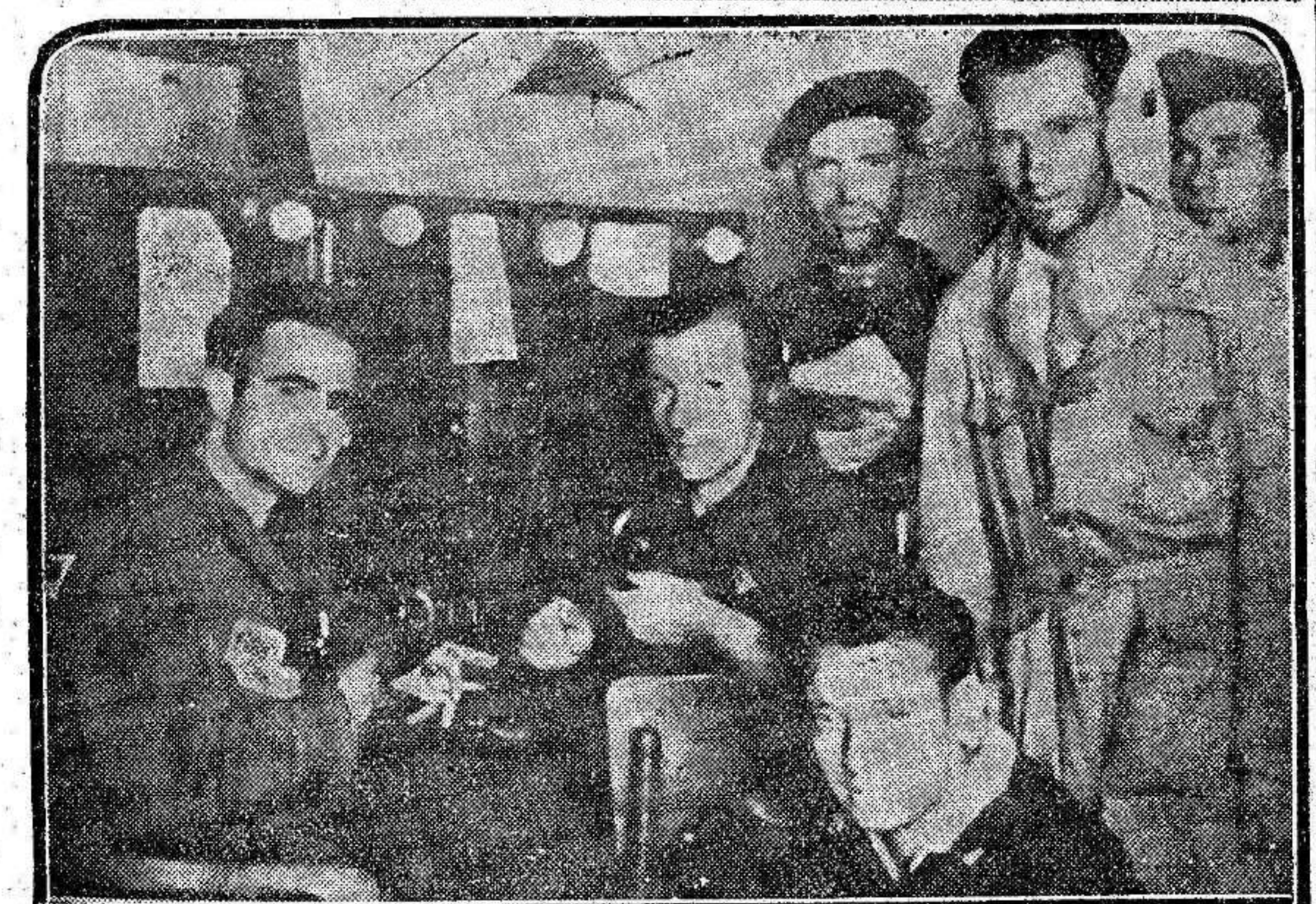
He aquí los entusiastas milicianos que tienen a su cargo la estación telefónica de Villalba. Cumplen ellos una de las más importantes misiones de la guerra. Trabajo continuo que resisten incansables con la satisfacción de saber que sirven a la República y al pueblo.

El movimiento que allí ha estallado—impulsado por la Marina de guerra, en Portugal el máximo crédito ha estado siempre en esta base defensiva—ha corrido por todo el territorio como reguero de pólvora, y no es sólo en Lisboa y en Oporto; es en Coimbra, en Caldas, en Elvas, en Espinho, en Foz y en una porción de pueblos más donde la gente se ha levantado en unánime protesta.