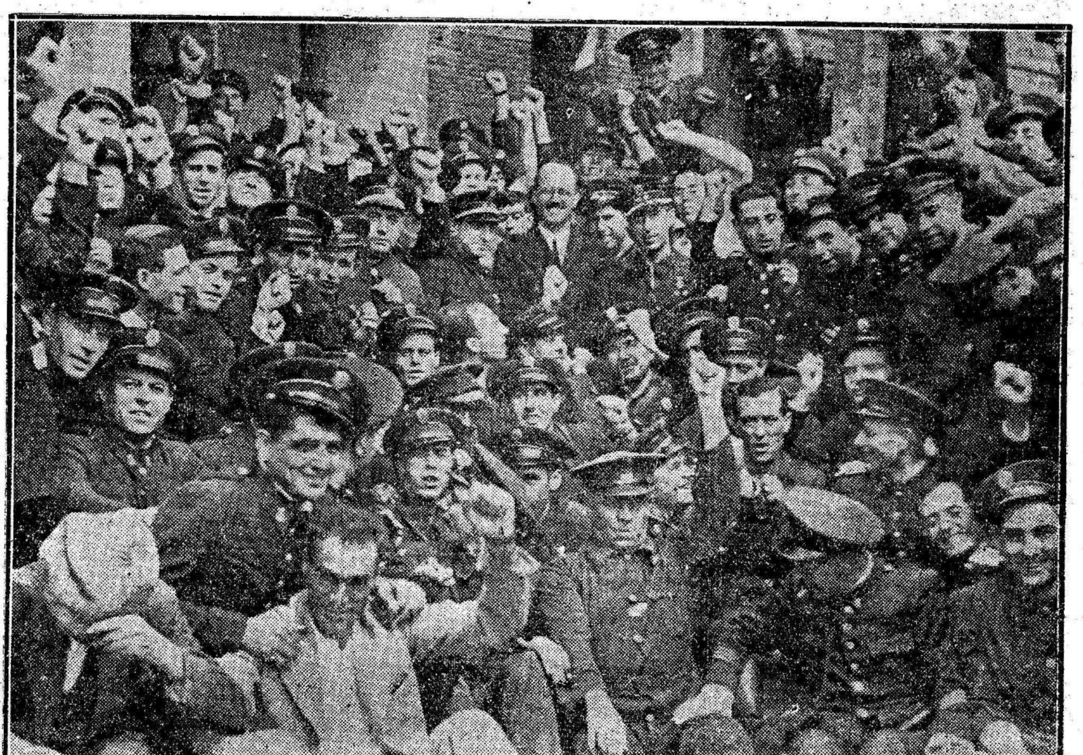
Los guardias de Asalto aclaman con gran entusiasmo republicano al gobernador civil de la provincia.