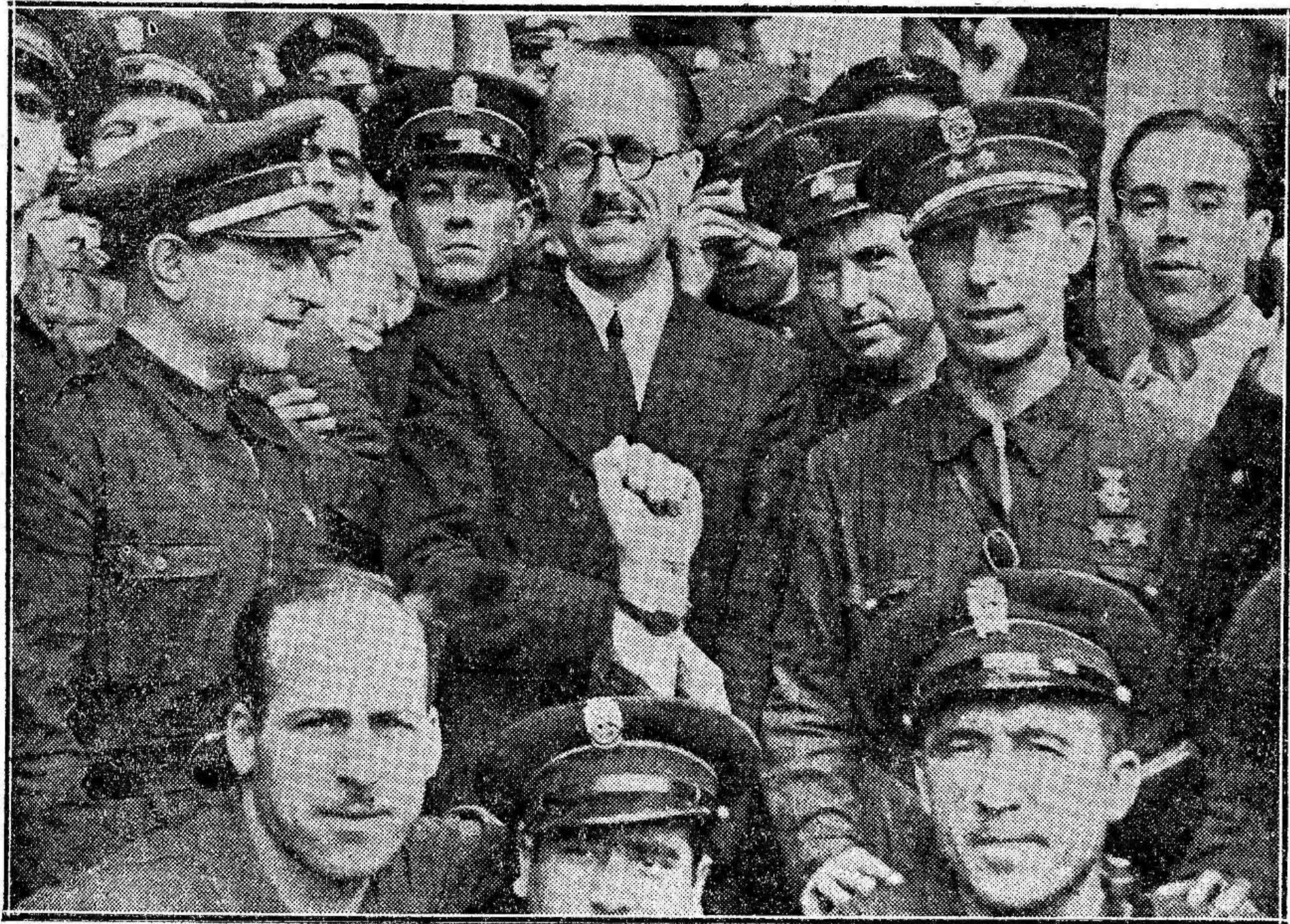
El gobernador civil, señor Jiménez Canito, rodeado por las fuerzas de Asalto.