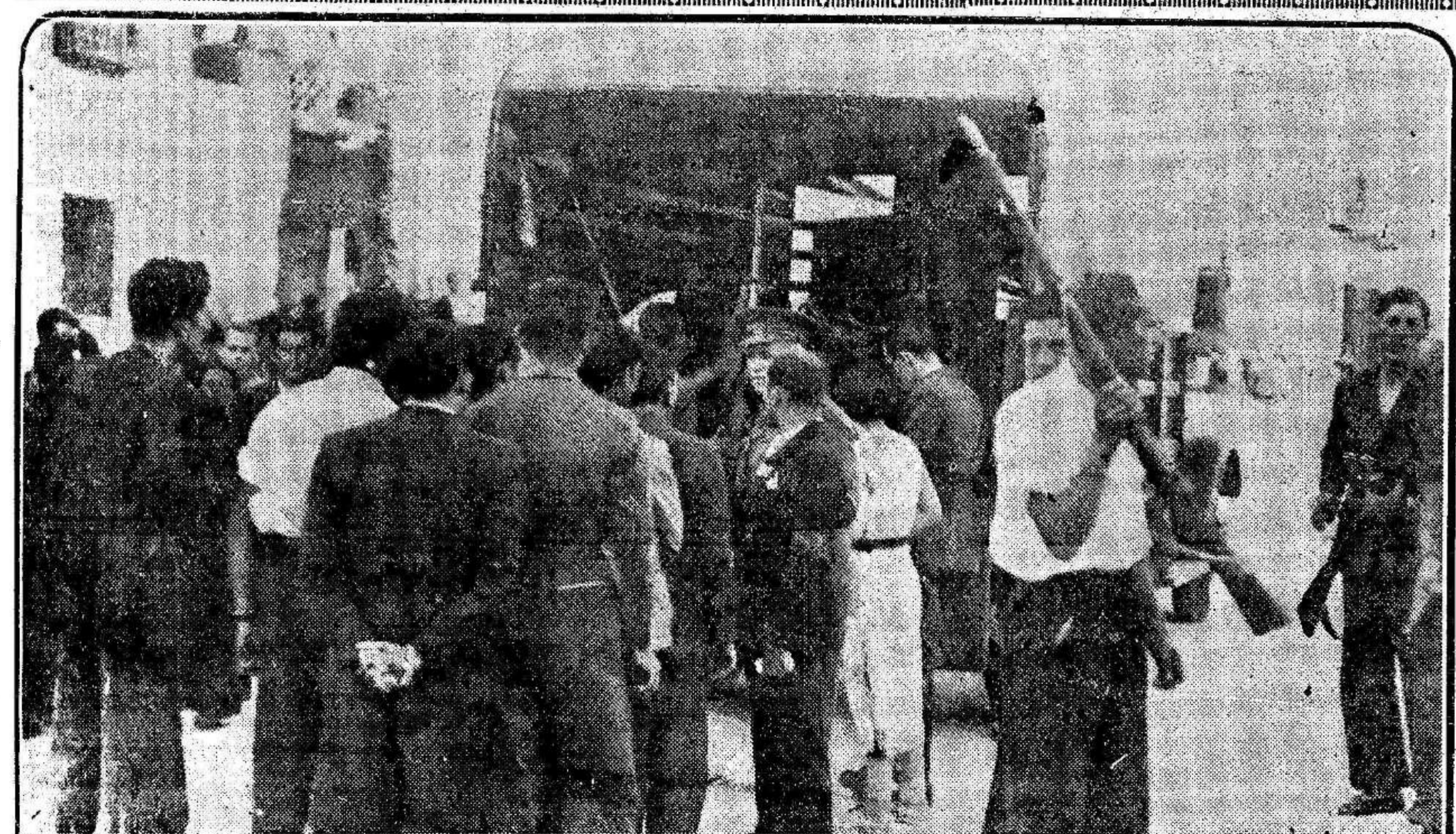
Un reparto de armas a las milicias populares en Madrid (Foto Díaz Casariego.)