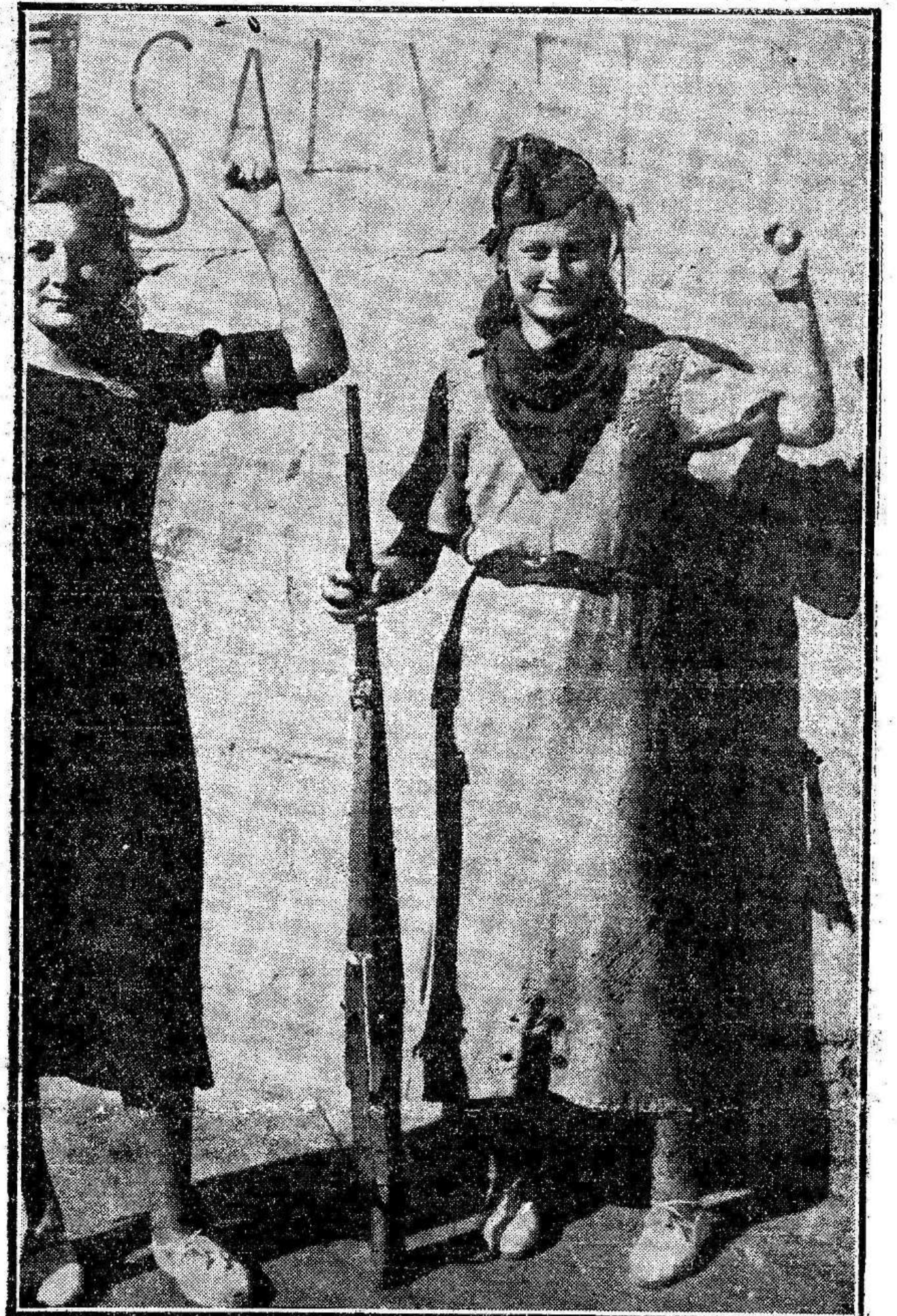
Dos bellas madrileñas, que se han distinguido por su arrojo en la lucha contra los sublevados en Guadalupe.