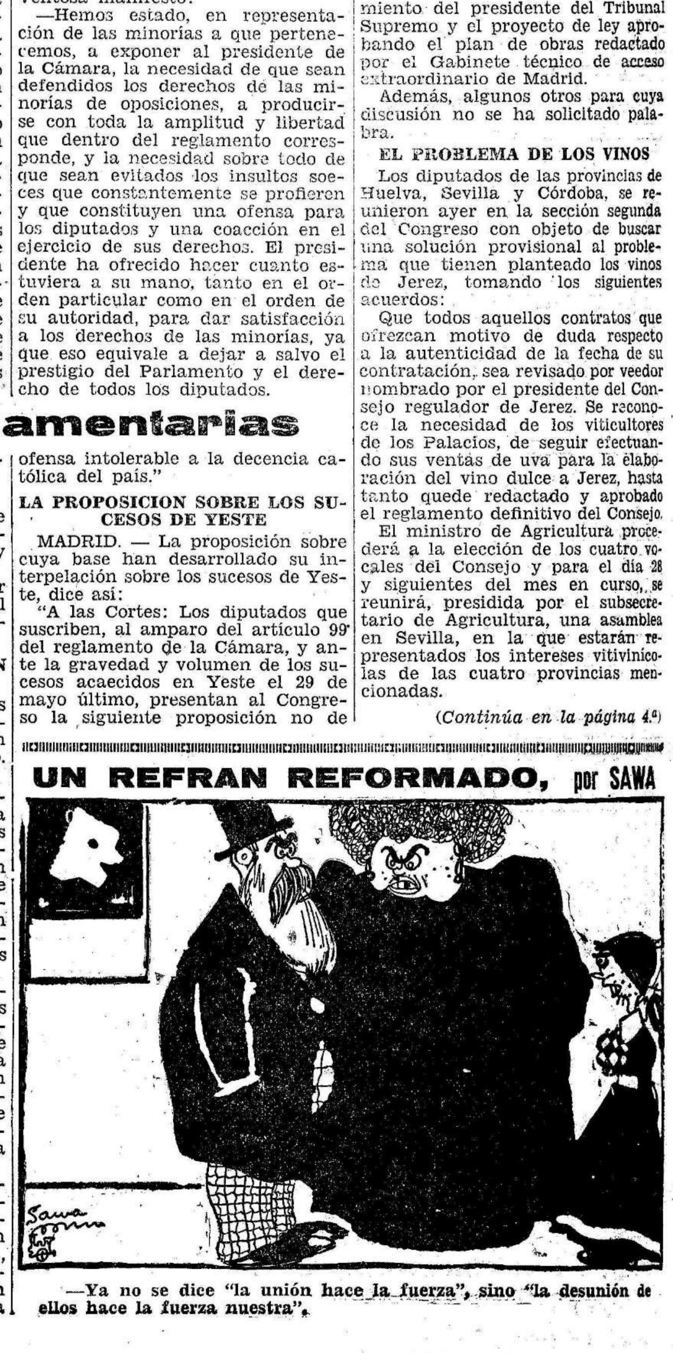
—Ya no se dice "la unión hace la fuerza", sino "la desunión de ellos hace la fuerza nuestra".