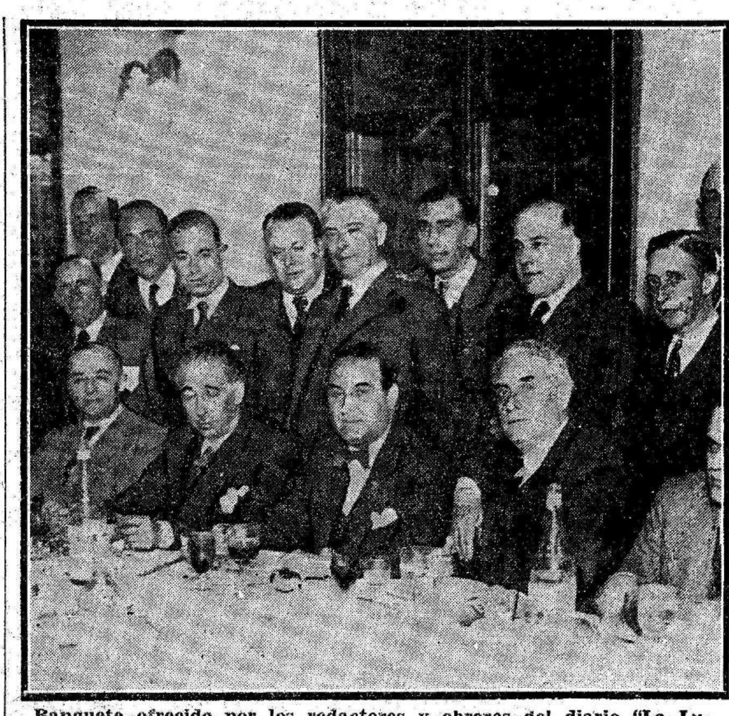
Banquete ofrecido por los redactores y obreros del diario "La Lucha", al que fué redactor jefe de dicho periódico, hace veinte años, don Luis Companys, el actual presidente de la Generalidad.