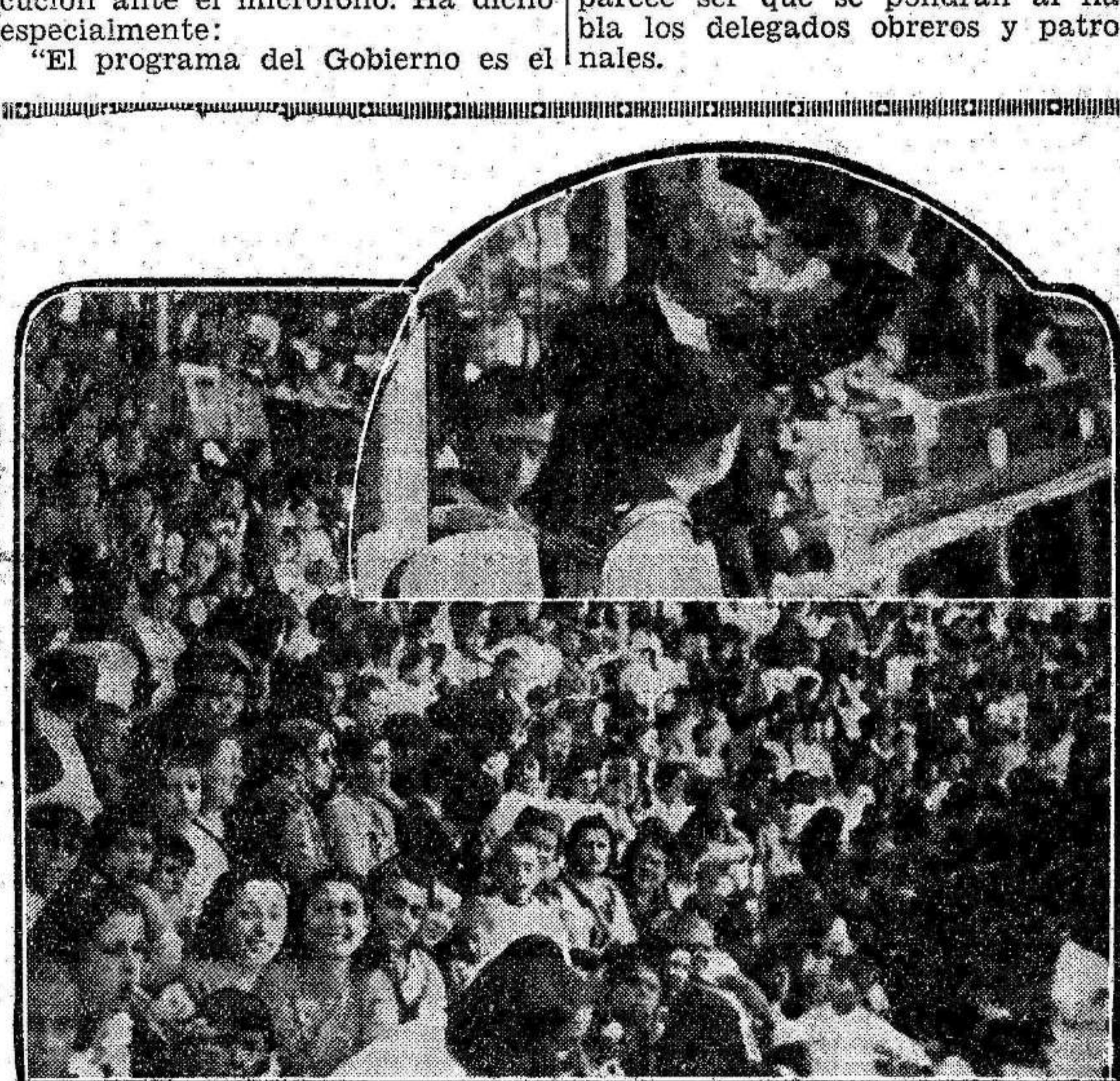
Un aspecto de los tendidos, en la becerrada que tradicionalmente organiza en Córdoba el Club Guerrita dedicada a la mujer cordobesa. En la parte superior, Guerrita saluda al público desde el palco principal.

CANTON.—Esta mañana se reunió en Canton el consejo político del Sureste que gobierna todo el sur de China. Según informas el Gobierno acordó desde la mañana contra el japonés enviando un ejército al norte del país para oponerse al avance de los ejércitos japoneses en la misma región.