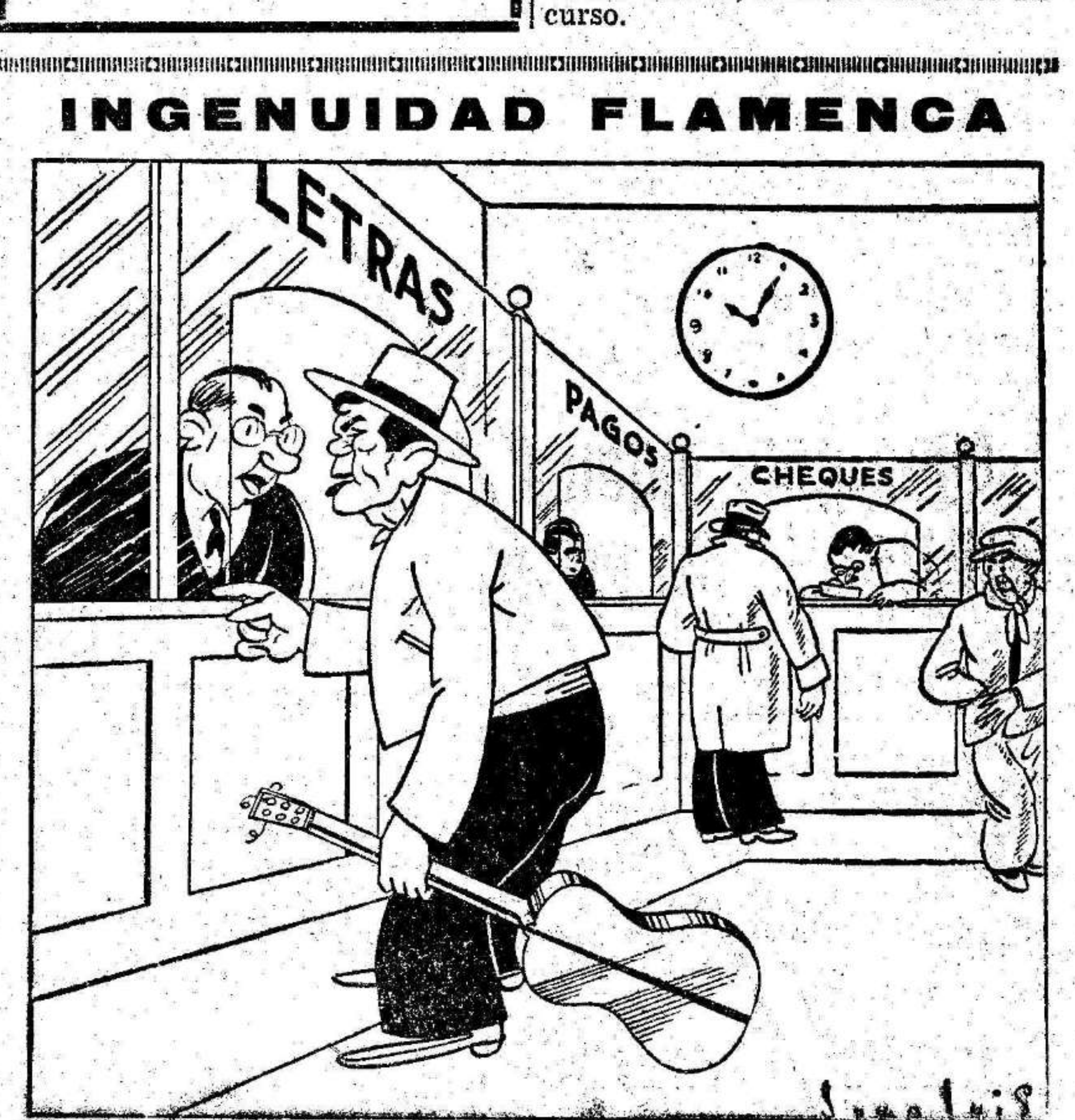
—¿Es aquí onde se pagan las letras?... ¡Po ve está a vó qué fandangos!