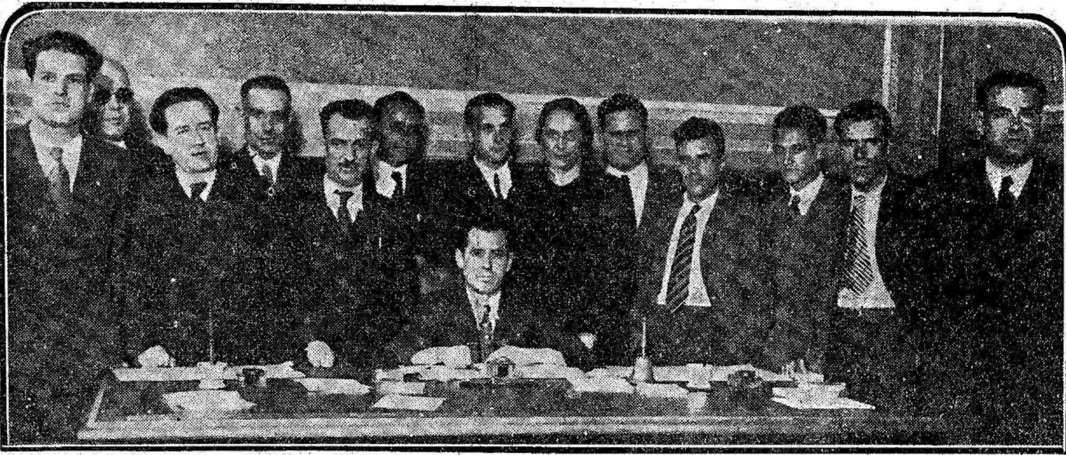
La minoría parlamentaria comunista reunida en una de las secciones del Congreso.