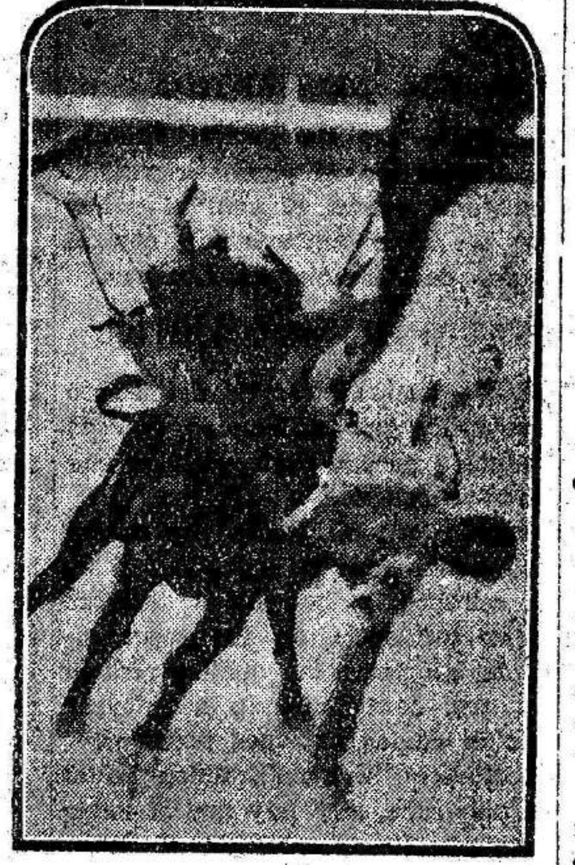
La aparatosa cogida de nuestro pal... La aparatosa cogida de nuestro pal...