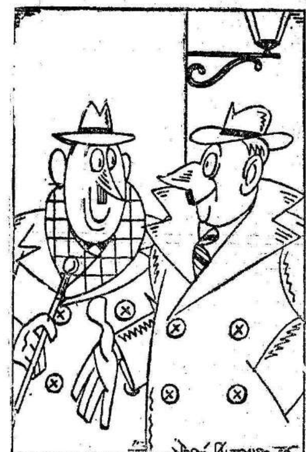
De modo que has perdido el crédito? — Por completo. Ya no como ni los platos que me ha prohibido el médico.