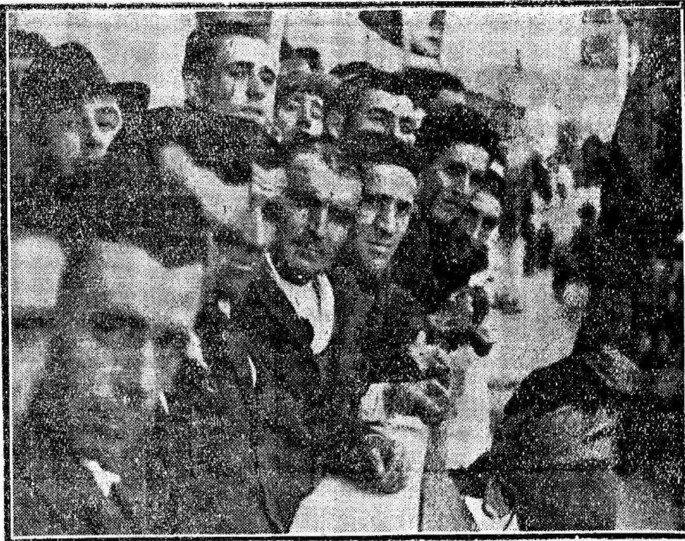
Desde el balcón del Ayuntamiento de Tetuán de las Victorias un grupo de amistiados corresponde a las aclamaciones de la multitud

Bogamos a nuestros abonados que cuantas deficiencias encuentren en el reparto del periódico, lo comuniquen a nuestra Administración, Tel. 1696.