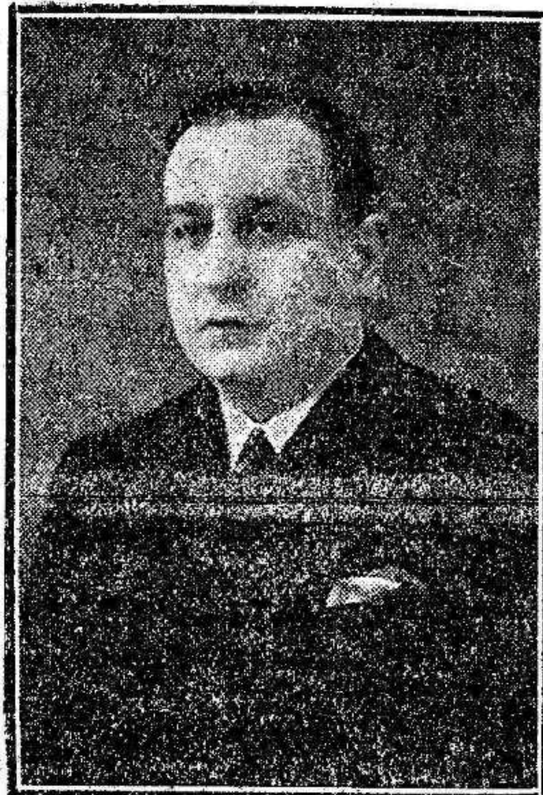
Don Amancio Muñoz de Zafra, diputado a Cortes, socialista, por la provincia de Murcia

NUESTRA INFORMACION TELEGRAFICA ESTA RECIBIDA POR TELETIPOS INSTALADOS EN NUESTRA REDACCION